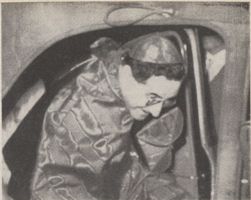
ROMA — IL CARDINALE GIUSEPPE SIRI