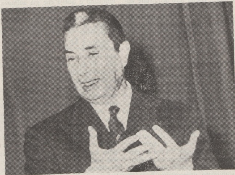
SAN PELLEGRINO — L'ON. ALDO MORO

Chi organizza per la DC questi convegni è il vicesegretario Scaglia, un professore di filosofia e storia che gli incarichi di partito hanno reso, col tempo, un politico puro. Le sue relazioni, al termine di questi congressi, son quelle che traggono dai dibattiti i corollari più pratici, i divieti e le cautele cui, a suo avviso, deve andar legata la direzione politica del partito. Forse una più organica meditazione sulla tematica dei convegni finirebbe per consigliargli una definizione più asciutta della loro unità. Nel nostro caso, si poteva eccellentemente serrare in una argomentazione unica la difesa dei partiti, come mediatori della sovranità popolare (a dispetto della concezione liberale dei partiti come diaframmi, che rompono il rapporto fiduciario di eletto ed elettore), e propriamente, quindi, come « forze politiche » — e la difesa della « democrazia aperta » (non « protetta », cioè), di fronte al comunismo, senza specifici accorgimenti di regime. C'è un'unica cultura e un'unica logica, a sostenere le due cause. E se a San Pellegrino si è perso tempo dietro a due filoni che apparivano distinti e divergenti, è solo perchè non si sono programmate relazioni che confluissero a definire come progressiva, quella democrazia che è lotta e raccordo di grandi partiti nella legittimazione degli organi rappresentativi; lotta, che nella sua re-