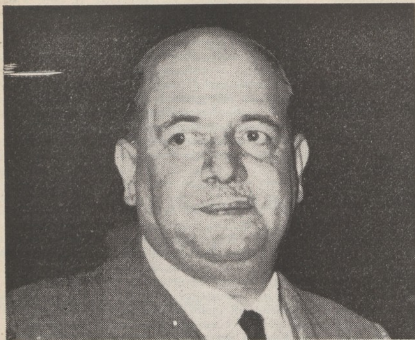
ROMA — IL MINISTRO GIUSEPPE TOGNI