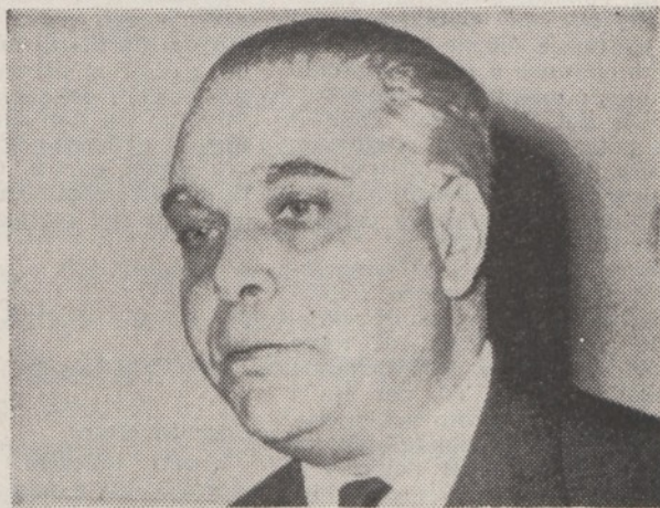
IL MINISTRO MATTARELLA

... Secondo l'on. Mattarella i mille miliardi della Federconsorzi non sono scomparsi, perchè lo Stato non li ha mai pagati. Spiegazioni di questo genere servono solo a buggerare la gente... A pag. 5: ERNESTO ROSSI CONFUTA LE AFFERMAZIONI DEL MINISTRO DELL'AGRICOLTURA.