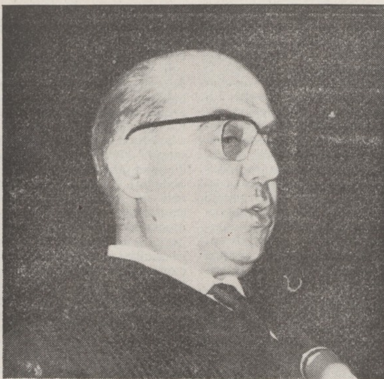
IL MINISTRO DEL LAVORO BOSCO