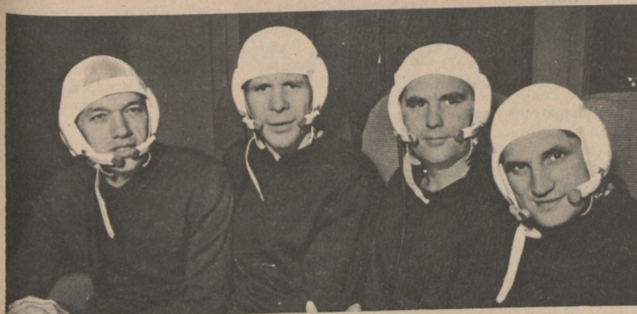
Mosca: i cosmonauti russi