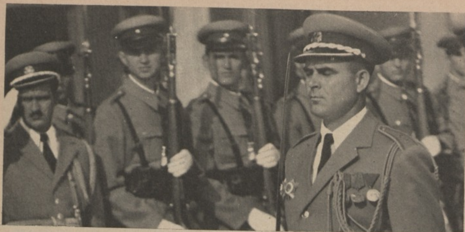
Belgrado: la parata militare