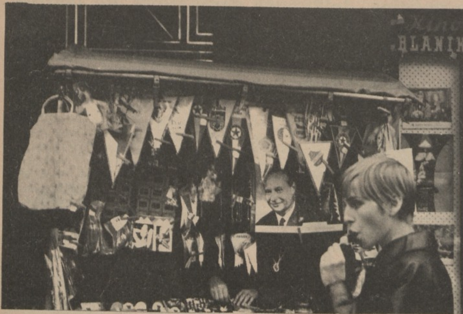
Praga: Dubček tra i souvenir

E' questo il significato della lotta, ed è ciò che ha fatto scegliere l'obiettivo apparentemente marginale — la fine della censura — ma tale da colpire a propria volta nel segno. Gli operai, parte dei quali erano stati scettici, con la libera discussione e il libero confronto avevano capito da che parte stare. Si tratta di non perdere questo legame e di non perdere gli strumenti che permettono di operare in profondità, isolando il vecchio corso stalinista.