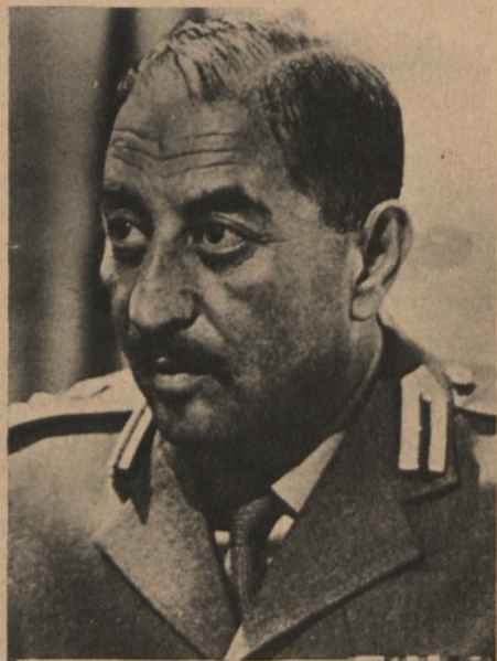
Il presidente irakeno Al Bakr

Comunque, anche se contraddetta da molti altri fattori, si registra oggi in quasi tutti i paesi arabi una corsa verso occidente che lascia intendere quanto forte sia la loro necessità di pace; anche se l'Islam non si convertirà improvvisamente all'America, come qualche commentatore sembra temere, appare evidente che i propositi di guerra contro lo stato ebraico sono, almeno per il momento, accantonati. Unica eccezione, l'Irak. Proprio in questi giorni, per bocca del ministro degli esteri Sheikly, i governanti di Baghdad hanno fatto sapere di non essere disposti ad accettare nessuna soluzione negoziata del conflitto, abbracciando così in pieno la tesi palestinese. Non è la prima volta che dalle rive del Tigri partono posizioni così drastiche: non bisogna dimenticare che l'Irak fu l'unico paese arabo, insieme con l'Algeria, a non accettare il cessate il fuoco del 9 giugno '67; che fu fra i pochissimi paesi arabi che avanzarono parecchie riserve sulla famosa risoluzione