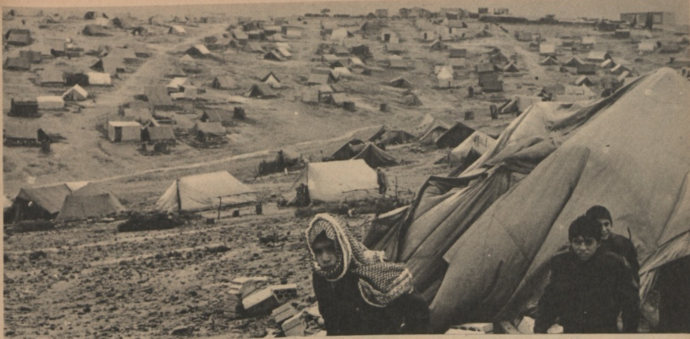
Giordania: un campo di profughi palestinesi

ONU del 22 novembre dello stesso anno. Come si spiega l'atteggiamento iracheno? E' possibile liquidarlo con la considerazione, puramente geografica, che le sue frontiere non toccano Israele?