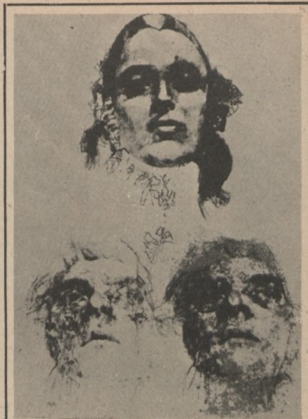
Renzo Vespignani - Litografia Ediz. Graphis arte