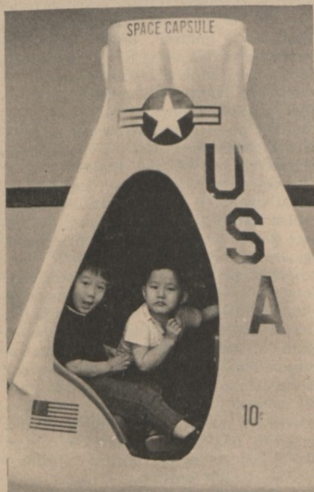
New York: la capsula di Chinatown