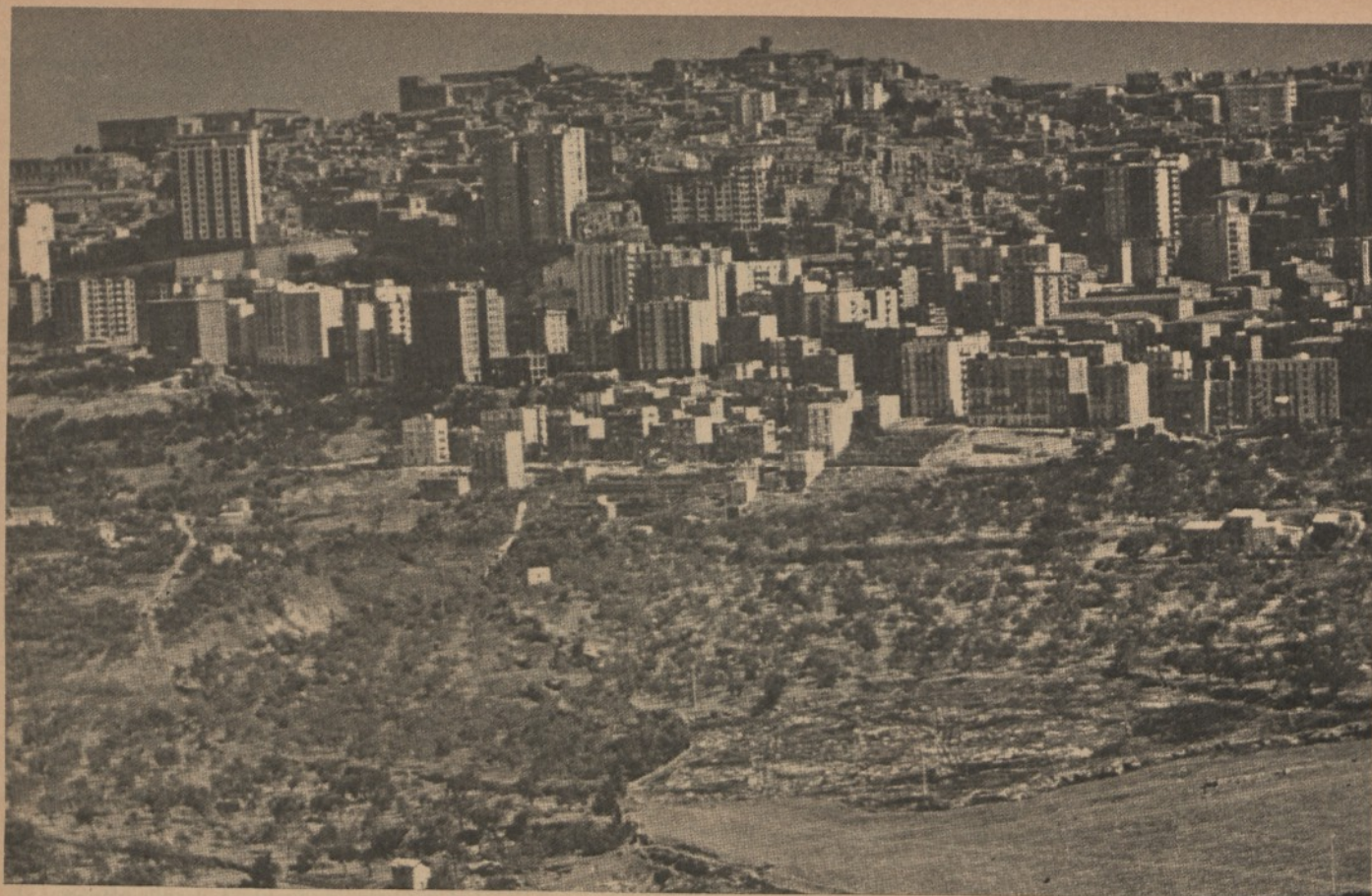
Agrigento: i grattacieli sulla valle dei templi