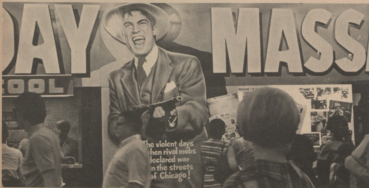
Chicago: il cinema domenicale

controllati i lanci fatti dalla Florida, dove quel centro avrebbe certo avuto una sede più logica.