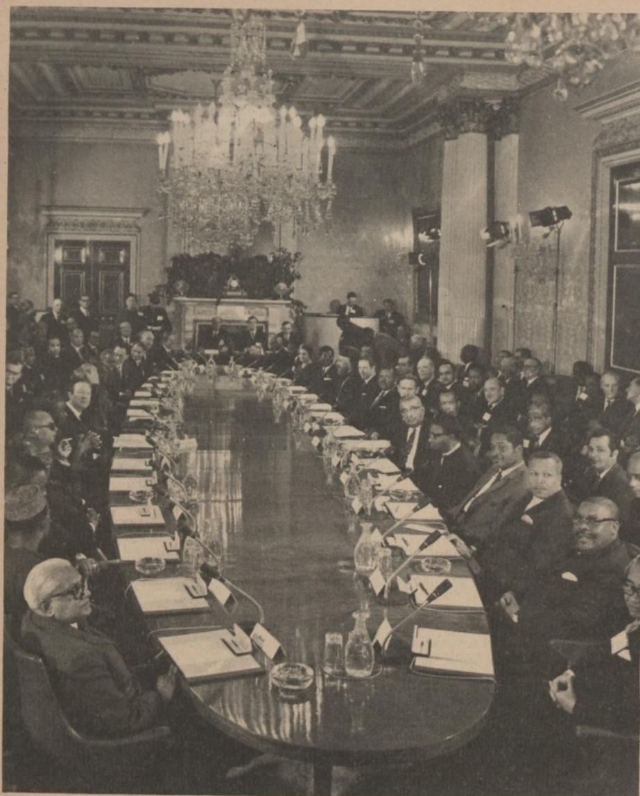
Londra: l'apertura della conferenza del Commonwealth