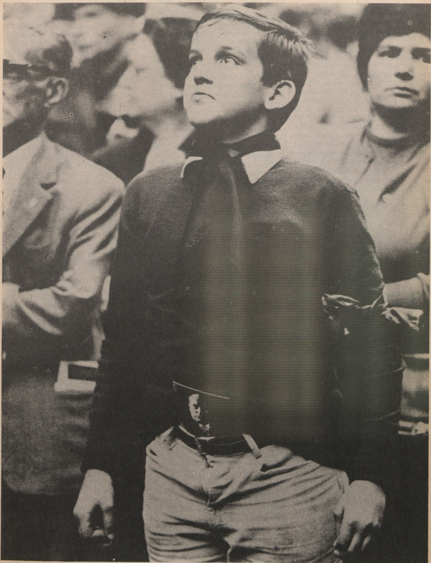
Nostalgie di Balilla