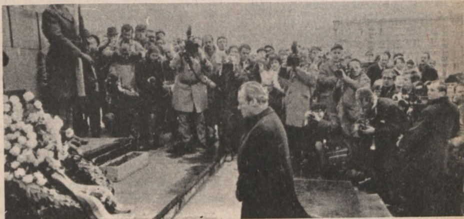
Il 48% dei tedeschi non è d'accordo...

A prima vista si direbbe che i tedeschi sono riusciti addirittura a rovesciare l'asserzione secondo cui esiste una crisi dei blocchi: il Cancelliere federale Brandt ha aperto a Est (trattati con URSS e Polonia, cui ne seguiranno altri) ma non riconosce la Germania orientale; Ulbricht si è irrigidito di fronte a una Ostpolitik che tende a scavalcarlo e che secondo il leader comunista salta a pie' pari il primo e il più legittimo degli interlocutori (appunto la Germania est). Eppure si è aperta una concatenazione di eventi complessa, contraddittoria, in fondo alla quale o si troverà un accordo fra le due Germanie o salterà il disegno politico di Brandt. Le massime potenze, USA e URSS, non lavorano certo per facilitare tale disegno: gli americani accettano soltanto, e con molta diffidenza, una Ostpolitik che aggiri la Germania orientale, ne prepari l'isolamento e poi il crollo; i sovietici calcolano di strumentalizzare Brandt ai fini di una erosione del blocco atlantico, e il principale rimprovero che muovono a Ulbricht è quello, se mai, di non accettare passivamente, nell'interesse del Cremlino, un « gollismo » tedesco-occidentale in politica estera utile per indebolire le posizioni americane nel continente europeo. Per questo USA e URSS vogliono esercitare la loro tutela sulle mosse di Brandt e di Ulbricht: intravedono l'occasione di creare una « zona grigia » nello schie-