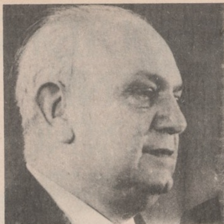
L'onorevole Francesco De Martino

brutta figura. La faticosa nomina del Consiglio di amministrazione della Montedison, provvisorio epilogo di una defatigante storia di trattative e di compromessi, debitamente intercalata da intrighi e colpi bassi, ha rivelato ancora una volta l'assenza dietro le partecipazioni statali dell'interlocutore Governo provveduto di una volontà politica: una sinistra libera dalle contese di potere finanziario, consapevole che i piccoli risparmiatori rappresentano nella nostra economia una categoria degna di attenzione, a parte i piani di riorganizzazione avrebbe saputo meglio provvedere per dare al risparmio la sicurezza della restituzione di un tranquillo titolo di cassetta, come sono per adesso quasi soltanto i telefonici. Fuori da indulgenze demagogiche, quando si fa così endemica e pericolosa la estremizzazione violenta dalle proteste di piazza, e così minacciosa la sistematica offensiva neo-fascista chi potrebbe dare migliore garanzia di sereno e fermo governo delle forze dell'ordine pubblico?