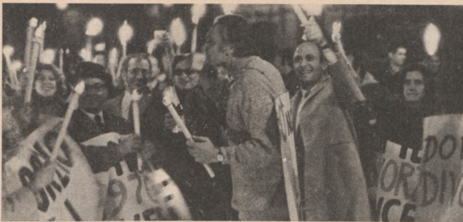
L'esultanza della LID

è chiaro, spetta alla Corte, e non a noi. E tuttavia la nostra curiosità e, diciamo pure, la nostra ansiosa attesa, ci inducono non soltanto a proporre quell'interrogativo, ma anche a formulare un'altra domanda, alla prima in un certo senso collegata (se pure, come diremo, relativa ad una questione sostanzialmente diversa): che cosa dirà, che cosa si appresta a dire la Corte — se già addirittura, mentre scriviamo, non si è pronunciata — sulla questione, in novembre sottoposta al suo esame, relativa alla costituzionalità dell'articolo 34 del Concordato?