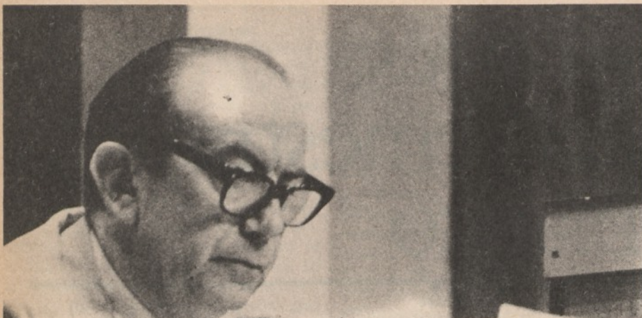
L'onorevole Carlo Donat Cattin

all'opinione pubblica come coinvolto in operazioni mafiose. Se questo disegno fosse davvero esistito, bisogna dire che La Malfa ha fatto di tutto per accreditarlo con una reazione passionale che lo ha portato ad assumere posizioni e sostenere tesi che, se fossero accettate, annullerebbero ogni possibilità di reazione della classe politica nei confronti di quei suoi esponenti che sono seriamente sospetti di collusioni mafiose. Conseguenza di queste polemiche sono state le dimissioni, concordate da due partiti, degli assessori repubblicani e socialdemocratici dalla Giunta regionale e la apertura della crisi a Palazzo Marino.