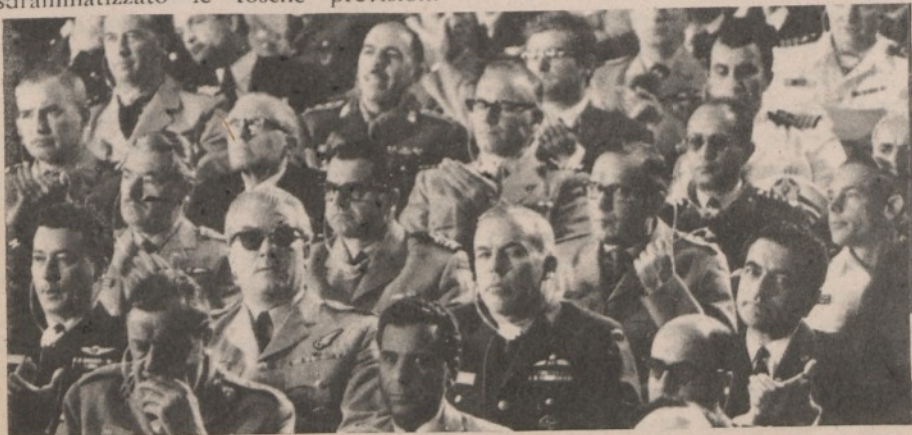
L'assemblea dei generali NATO