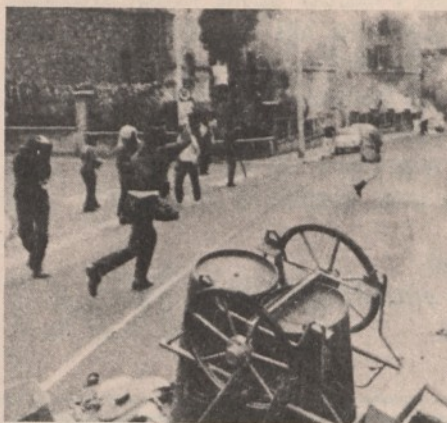
Giustizia alla giustizia?

gli affari (ad esempio cause di lavoro), sono idee stroncate al solo loro apparire sulla ribalta della dialettica aperta sul tema di una rigenerata organizzazione della giustizia.