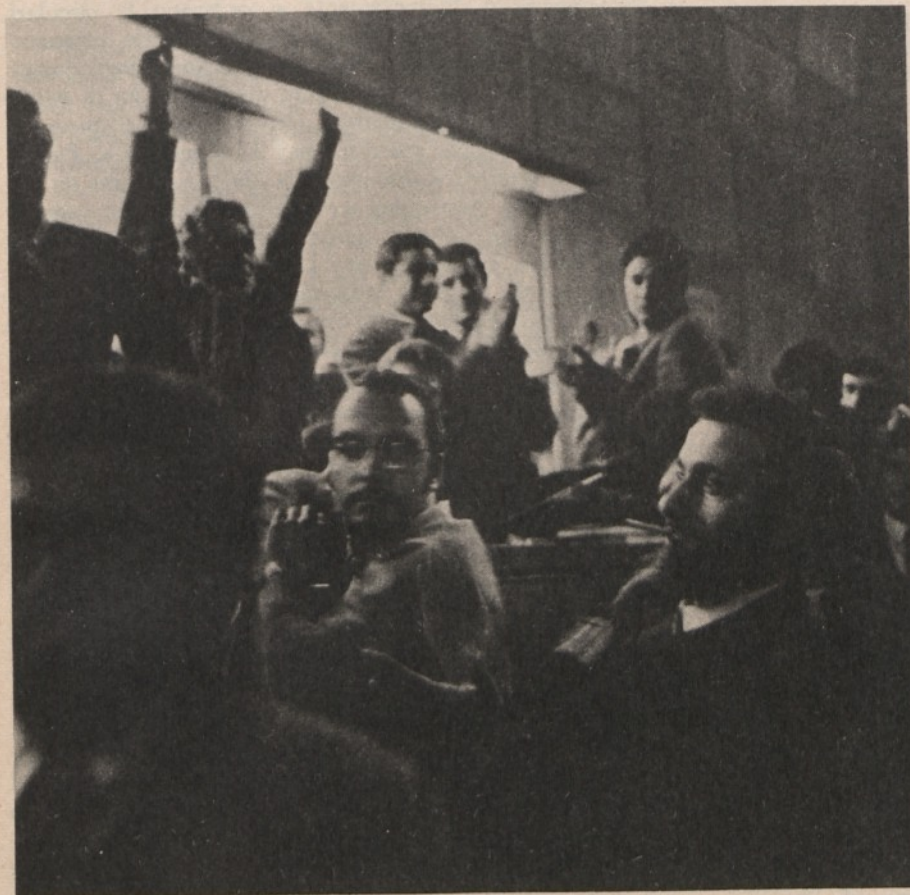
Dibattito in facoltà