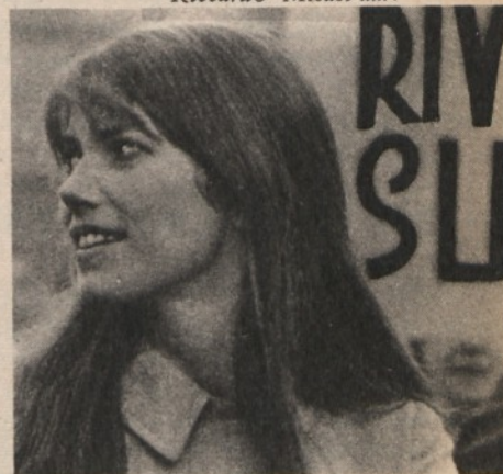
..... sbaglia strada

Il movimento degli studenti ha fatto scoprire, fuori delle aule, una cultura e valori che le istituzioni scolastiche hanno sempre, volutamente, ignorato. Nella « controscuola », nelle manifestazioni ed occupazioni, si esprime una spinta di libertà che investe tutta la società italiana. Mentre la classe politica e le burocrazie che