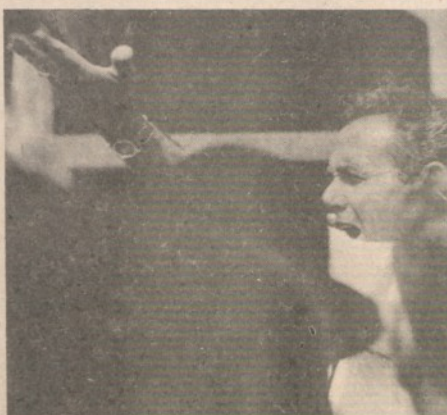
Durante uno scioper...

E qui ricado nelle mie contraddizioni che ho già altre volte confessato. Il centro-sinistra, come si è ridotto da noi, non mi va: è una formazione, in termine proprio e senza ingiuria per nessuno, bastarda. Pure, anche in questo momento che ha varie ragioni di esser critico, relative in primo luogo alla situazione economica, io non mi assumerei, se dipendesse da me, la responsabilità di aprire una crisi, che inciderebbe malamente su una situazione già deteriorata dalla passata e presente incertezza.