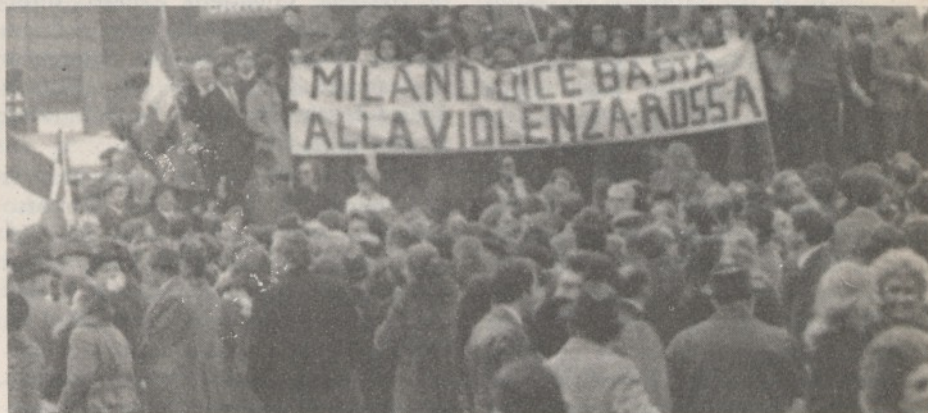
La « maggioranza silenziosa » manifesta in piazza Duomo

Per gli operatori economici milanesi le idee di Martin, Saragat e Colombo non sembrarono affatto originali: da mesi se le sentivano strombazzare nelle orecchie dalla propaganda della maggioranza silenziosa. Gli stessi appelli li aveva lanciati il Comitato cittadino anticomunista e i