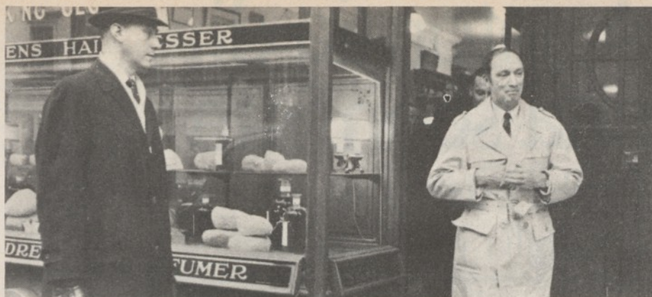
Il leader canadese Trudeau

cui la componente del commercio con l'estero ha una così massiccia influenza sulla situazione economica generale. Problemi da meditare questi anche per le nostre autorità monetarie: quando non si incide sulle strutture e sulle linee di fondo dello sviluppo (ipotesti che sono al di fuori della portata della attuale politica economica canadese, guidata da uomini che credono ancora nel verbo liberista anche se non ne danno una interpretazione moderata e — tanto per intenderci — malagodiana) i provvedimenti monetari finiscono solo col risolvere aspetti marginali del problema, aggravandone a dismisura altri o creandone dei nuovi.