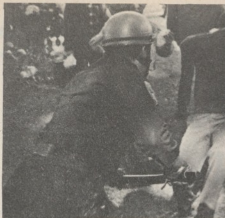
USA: la polizia interviene contro dimostranti radicali

L'affare Calley sono cominciati non solo a venire alla luce ma a diventare di pubblico dominio e argomenti di aperta discussione tutti i problemi connessi con il deterioramento della situazione dei militari in Vietnam, l'uso continuo e diffuso della droga, il normale regolamento dei conti tra individui e corpi dell'esercito americano, lo stretto rapporto tra violenza esercitata sulle vittime tramite massacri, crudeltà e stupri e la violenza che si è impossessata degli stessi esecutori-soldati nei comportamenti reciproci in Vietnam e nell'atteggiamento verso la società americana.