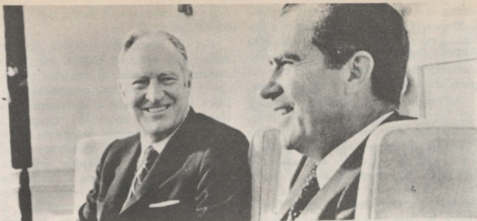
Il segretario di Stato americano William Rogers

arabo israeliana. Non ci fu bisogno di aiuti militari diretti perché le armate di Dayan vinsero sul campo senza molte difficoltà, e gli Stati Uniti assunsero di diritto al rango della grande potenza amica di cui Israele, come non si stanca di ripetere Ben Gurion, non può fare a meno per sostenere una politica « dinamica » nei confronti del nazionalismo arabo. Dal 1967 ad oggi la diplomazia americana (Nixon lo capì fin dalle prime battute della campagna elettorale, al punto da farsi sfuggire promesse « revisionistiche » un po' azzardate rispetto alla linea osservata da Johnson) ha avuto come suo obiettivo specifico di attenuare questa identificazione sgradita se non altro perché rischia di restituire all'Urss la patente di solo « scudo » degli arabi che nel 1956 Eisenhower riuscì a scongiurare, e nello stesso tempo di non compromettere le relazioni preferenziali con Israele. Prima Sisco e poi Rogers si sono esposti in questo senso. Oggi Rogers arriva all'« eresia » procedurale di visitare — lui segretario di stato — un paese con cui il governo degli Stati Uniti non intrattiene rapporti diplomatici.