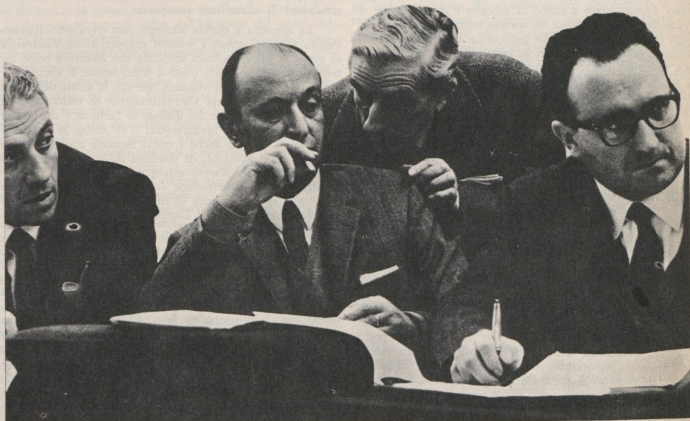
Una delegazione della Confindustria al Ministero del Lavoro

Lo « speciale » che presentiamo non vuole rispondere a tutte queste domande, che costituiscono piuttosto la trama di un filone di ricerca su cui l' Astrolabio conta di tornare con sempre maggiore frequenza. Gli articoli che seguono sono da considerare piuttosto un contributo, legato ai problemi posti dall'attualità su questa tematica. →