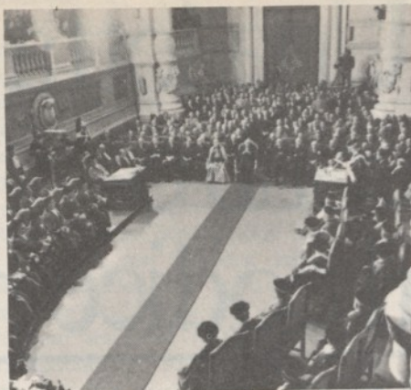
Una cerimonia al palazzo di Giustizia di Roma

penale proposti per l'abrogazione. In attesa di tale testo, e della relativa relazione che l'illustrerà all'opinione pubblica, può essere utile qualche anticipazione.