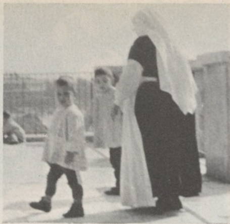
L'asilo delle suore

primaria del potere legislativo: la realizzazione del dettato costituzionale con l'eliminazione delle norme con esso incompatibili.