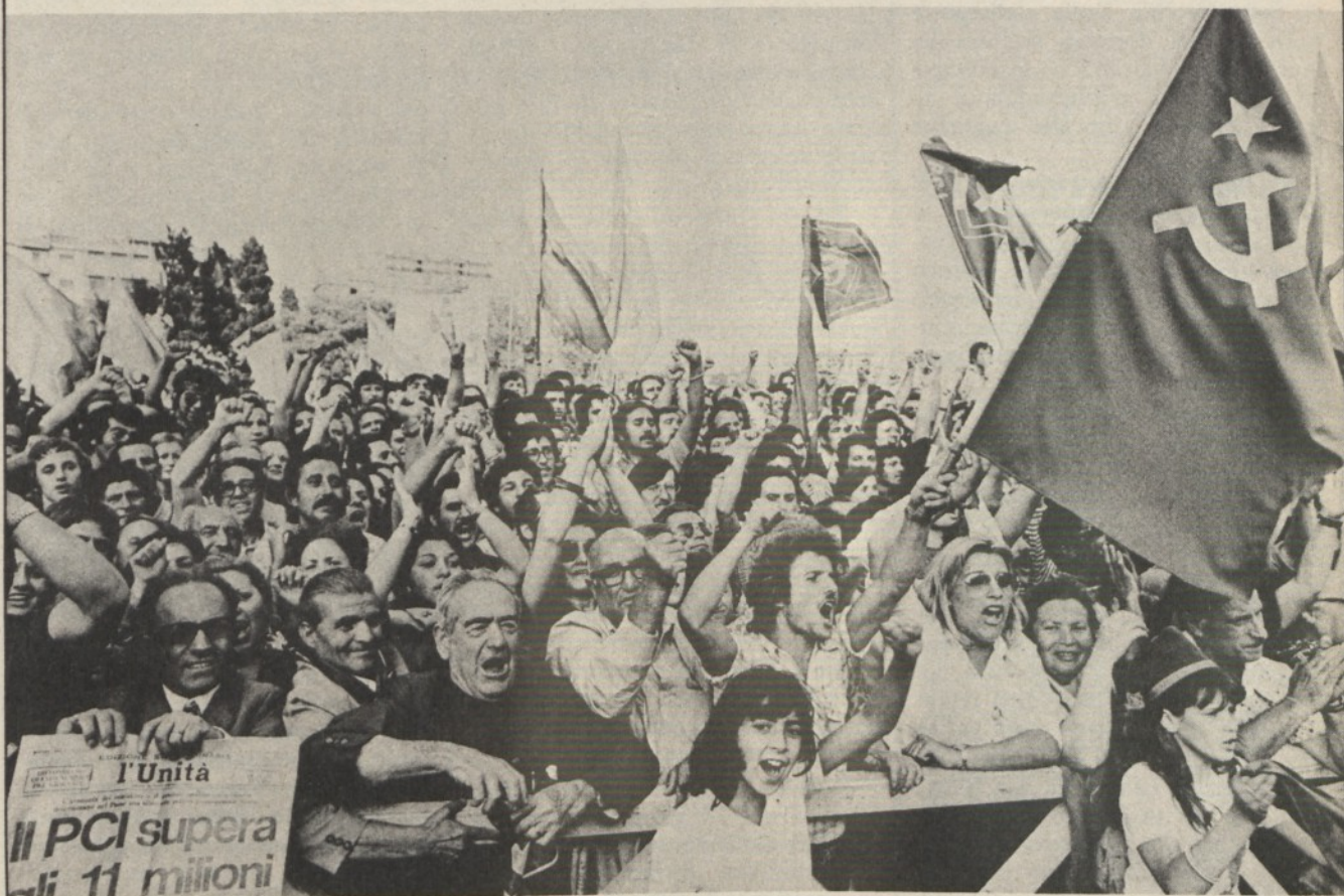
Roma, Piazza S. Giovanni, il giorno dopo

● Tra i molti errori che mi condurranno certo diritto all'inferno devo mettere la scarsa stima per gli italiani, come popolo, s'intende. Quanta incertezza quando si doveva votare il referendum per il divorzio! E poi la sorpresa: quasi un fulmine, che inceneriva l'incauto Fanfani. Anche oggi è un fulmine che spazza via, anche questa volta, le previsioni, sempre incaute, di Fanfani, sotto il peso di una vittoria di popolo destinata a stabilire un nuovo momento, un nuovo