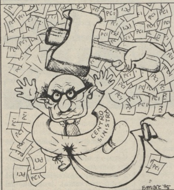
NAUFRAGIO DI MEZZO GIUGNO