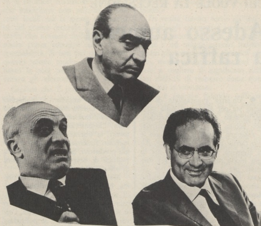
Fanfani, Visentini, Colombo

La vicenda però travalica la circostanza, e pone alcune amarissime considerazioni che toccano un po' tutti. Dalle « distrazioni » sempre più frequenti del Parlamento nella sua primaria funzione di controllo; a quelle della Federazione sindacale che per inavvertenza lascia che si creino in Italia due categorie di lavoratori: quelli che scioperano a spese dello Stato, e quelli che pagano di tasca propria. Incrementando ulteriormente il processo di terziarizzazione della nostra economia, il parassitismo di massa, così ben