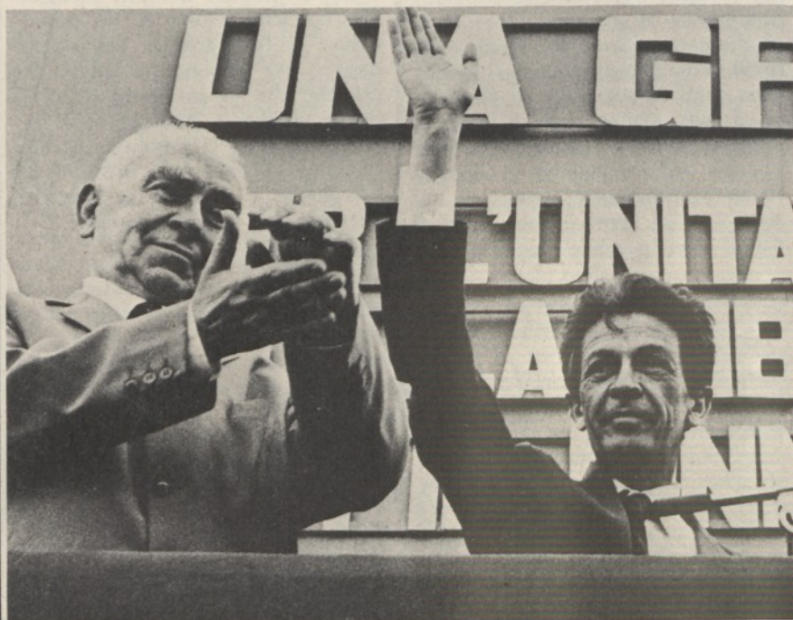
Roma, Longo e Berlinguer a S. Giovanni

● Alle nove di sera di martedì 17 « il giornale del terzo », con il tono distaccato che caratterizza quel canale radiofonico (riservato agli « addetti ai lavori »), dava notizia di un avvenuto « sfondamento » del PCI « nell'area dei ceti medi » e della possibilità (eravamo a un quarto dei voti scrutinati per le elezioni regionali) che il PCI contendesse alla DC il primo posto tra i partiti politici italiani. Impazzivano in quelle ore gli addetti al calcolatore elettronico del Viminale (come è noto i calcolatori elettronici in quanto macchine non possono impazzire), mentre (funerei) Fanfani, Orlandi, Bignardi e i loro amici amaramente profetizzavano sulle future sventure d'Italia ormai avviata verso esperimenti di tipo « collettivistico ».