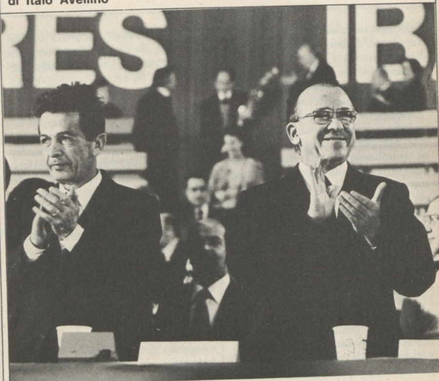
Berlinguer e Carrillo

(2) Il quoziente di mortalità nel solo primo anno di vita era allora di 43,1 per mille.