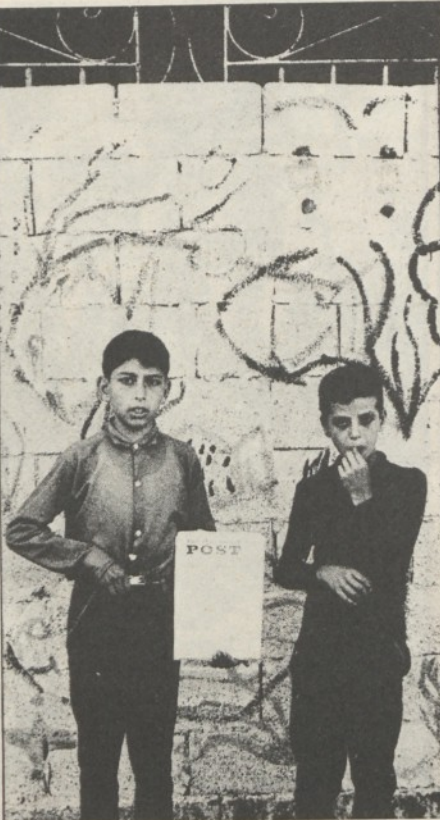
Gerusalemme: la vendita del « Post » nell'ex zona araba della città

● Commentando il recente dibattito all'ONU sull'indebita colonizzazione israeliana delle terre arabe occupate, l'« Economist » scrive che non è tanto il « modo » dell'occupazione che conta quanto l'occupazione in se stessa, che deve finire. Nel suo intervento al Consiglio di sicurezza, il delegato americano Scranton ribadisce che gli Stati Uniti restano fedeli alle risoluzioni n. 242 e 338 (ritiro da tutti i territori occupati) e che comunque « la presenza di questi insediamenti è considerata dal mio governo come un ostacolo al successo dei negoziati per una pace giusta e definitiva fra Israele e i suoi vicini ». Al momento del voto, però, gli Stati Uniti bloccano con il veto una risoluzione di deplorazione per la politica di Israele. O gli americani si contraddicono oppure, rovesciando l'analisi dell'« Economist », difendo-