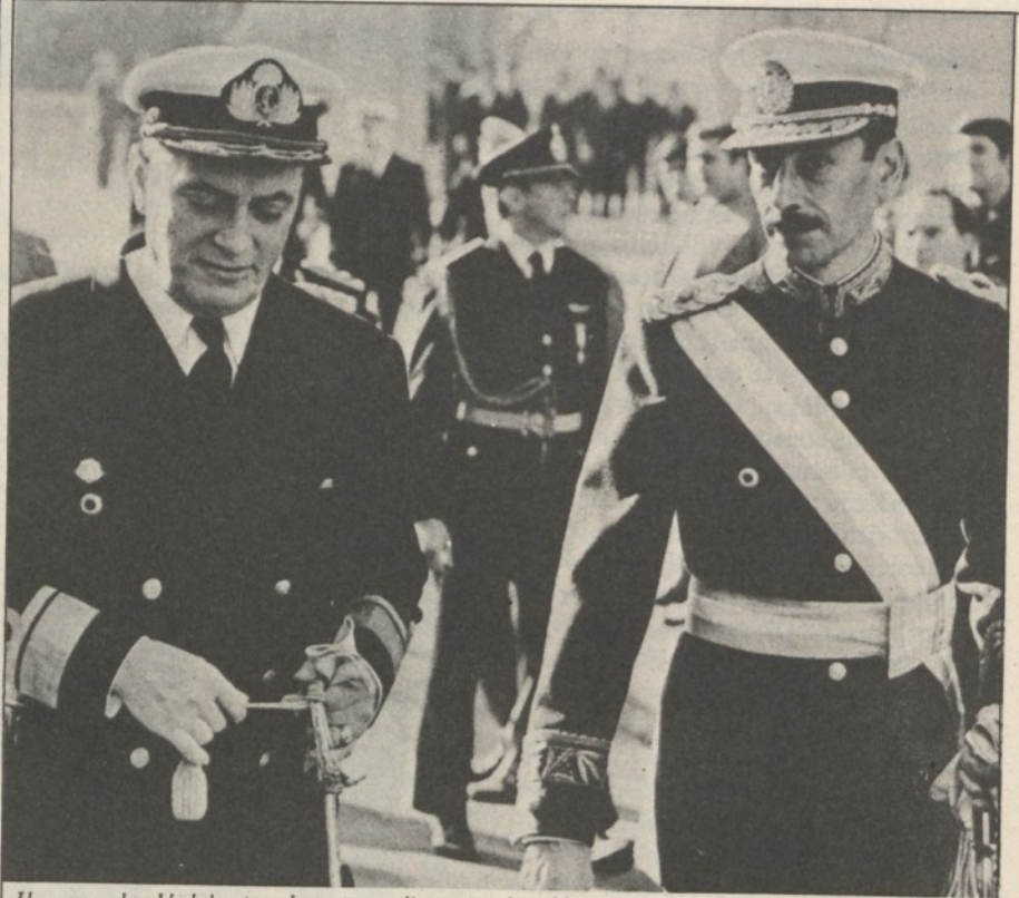
Il generale Videla (a destra) e l'ammiraglio Massera

● Preannunciato ed atteso da mesi, descritto con minuzia di particolari dai giornali dei giorni immediatamente precedenti, il settimo golpe degli ultimi cinquantanni di storia argentina è scattato il 24 marzo. Due giorni dopo diventava presidente della nazione, il comandante in capo dell'Esercito, generale Jorge Rafael Videla.