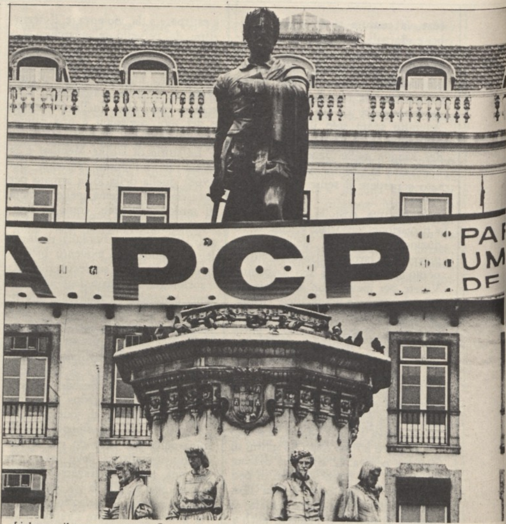
Lisbona, il monumento a Camoens; sotto, i cantieri Lisnave

I numeri parlano chiaro: in Portogallo sono rimasti a galla tre partiti che rappresentano praticamente