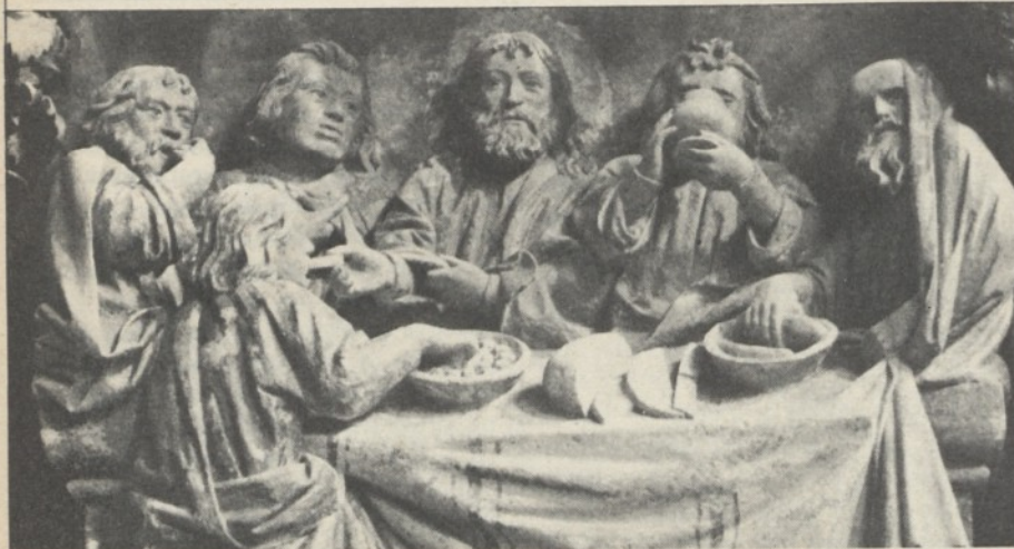
L'« Ultima Cena » del Maestro di Naumburg

ma a lui nessuno ha voluto finanziare il film. Non sarebbe stato commerciabile, come altri suoi, malgrado il loro alto valore, come non è commerciabile la predicazione se è vera e perciò rigetta la religiosità comune.