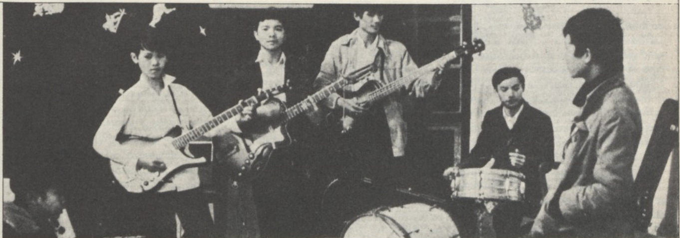
Saigon: le chitarre elettriche come preda bellica?

ma non troppo se è vero che paesi come l'Italia e la Tunisia o la Tunisia e la Libia non riescono a trovare un accordo sulla delimitazione dei diritti di pesca e della piattaforma continentale). Mentre Pham Van Dong brinda con i reduci di Dien Bien Phu e incontrerà magari di qui a qualche tempo il generale Westmoreland, Castro ha in programma un « rendez-vous » con i comandanti della Baia dei Porci?