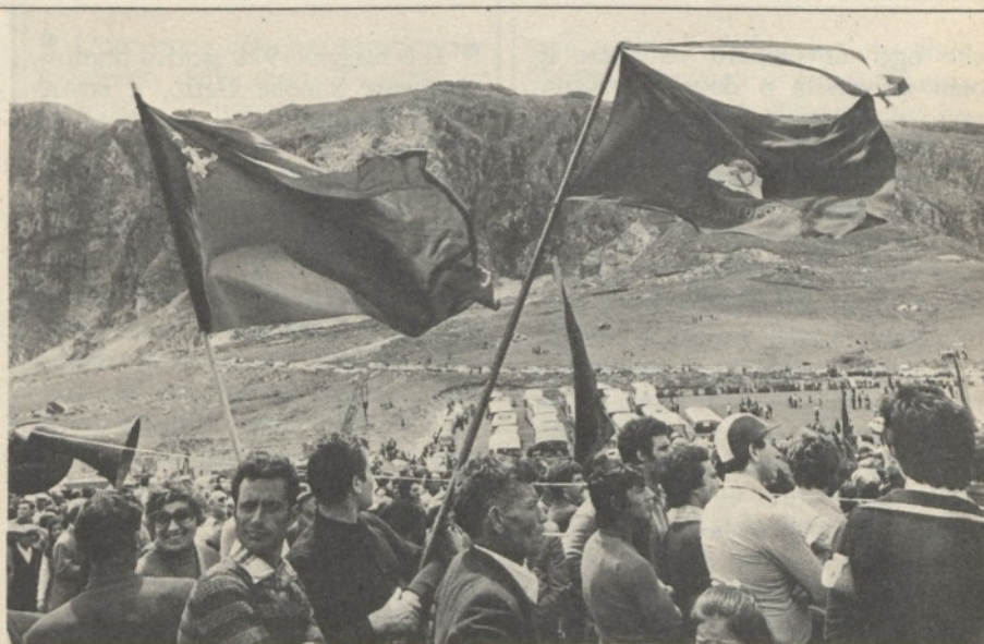
Portella della Ginestra: 1° maggio 1977

dividuare nel nascente Partito Comunista, nel grande respiro nazionale di Antonio Gramsci, lo strumento più valido per la lotta al fascismo e per la riaggregazione delle grandi energie del socialismo italiano, sconvolte in quegli anni cruciali dalle tempeste reazionarie. Li Causi mantenne, sempre viva nel Partito questa sua matrice, l'idea dell'unità popolare e socialista, del legame con gli strati più larghi del popolo, del Partito legato al popolo. Durante la vita clandestina, i 15 anni scontati tra carcere e confino, durante la guerra di liberazione, maturò ancora di più la concezione dell'unità. Non gli fu quindi difficile, nel 1944, immergersi nella più difficile realtà del dopoguerra — la Sicilia — ed intraprendervi una grande opera di costruzione democratica, di unità e di lotta delle forze popolari e contadine, contribuire in modo determinante all'elaborazione di quella strategia unitaria e democratica che portò all'Autonomia e allo Statuto.