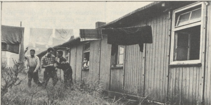
Baracche per lavoratori italiani nel Bernese

gelida, quasi perfida definizione di contro-realtà. « E accanto a tutto questo la vita di un uomo qualsiasi, occidentale nel mio caso, meglio, svizzero, brutto tempo e congiuntura, affanni e tormenti, sconvolgimenti per pasticci privati, senza alcun rapporto col resto del mondo, con ciò che avviene e che non avviene, col dipanarsi delle necessità [...]. Non vi è più un dio che minacci, né una giustizia, né un fato come nella quinta sinfonia; ci sono solo incidenti del traffico, dighe che crollano per errori di costruzione, l'esplosione di una fabbrica di bombe atomiche provocata da un assistente di laboratorio un po' distratto, incubatrici mal condizionate ».