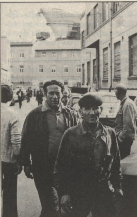
Palermo: cantieri navali.

Alcuni settori del movimento invece richiedono una esasperata autonomia delle singole categorie impegnate nei rinnovi contrattuali, rifiutando di affrontare seriamente la politica salariale, contraddicendo