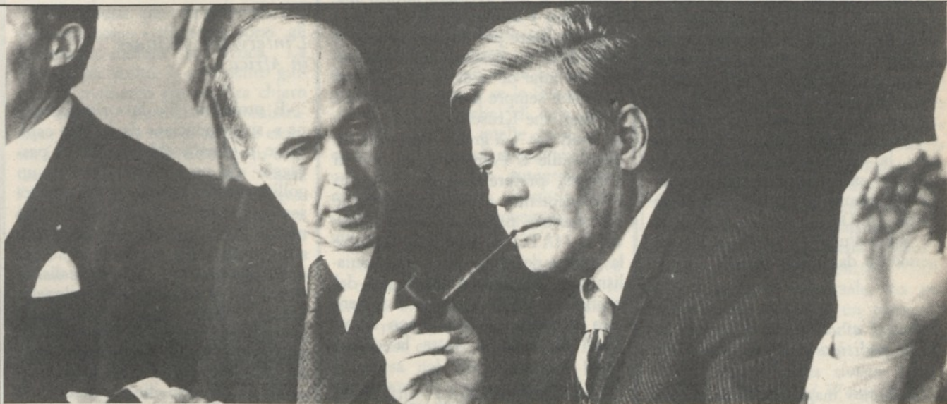
Giscard D'Estaing, Schmidt.

● Mentre le sinistre assistono impotenti, i gollisti accusano Giscard di avere sconfessato tacitamente tutti i presupposti su cui era solita reggersi la politica della Francia. La critica può apparire paradossale, visto che solo adesso la Francia realizza in qualche modo i miti della « grandeur », ma ha una sua logica se si pensa al tema dell'autonomia. In prima pagina ci sono le iniziative in Africa: le spedizioni dei « paras », gli interventi dell'aviazione, l'organizzazione dei francofoni in funzione antisovietica e antirivoluzionaria. Sullo sfondo, come quadro capace di dare un senso a questi « exploits », c'è la riconsiderazione del ruolo generale della Francia, nei confronti delle alleanze e delle grandi potenze. Ci sono o ci saranno conseguenze per gli equilibri in Europa e nel mondo?