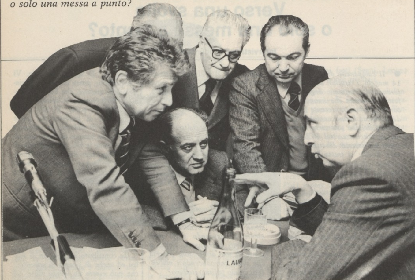
Da sinistra: Barca, D'Alema, Di Giulio, Peggio, Napolitano.

pensi al presidente della Camera, in compiti di direzione dello Stato. Tutto ciò ha portato ad un minore impegno nell'esame di alcune questioni di media e lunga prospettiva, e si è riflesso negativamente nella discussione sul progetto. E' una difficoltà da superare.