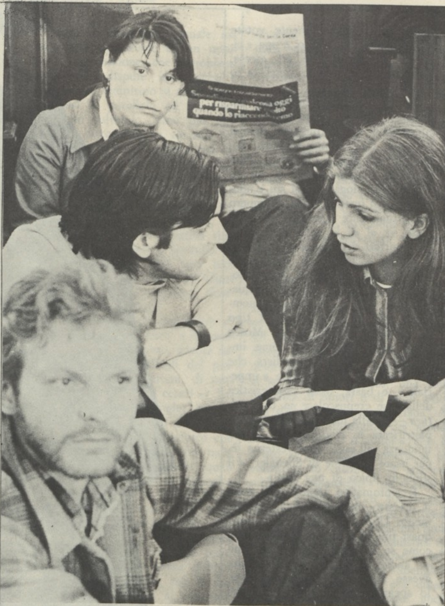
Studenti e disoccupati in assemblea a Napoli

E' il caso di Giorgio Bocca che, su La Repubblica del 24 settembre, con la scusa di riportare i commenti raccolti fra la gente, fa un