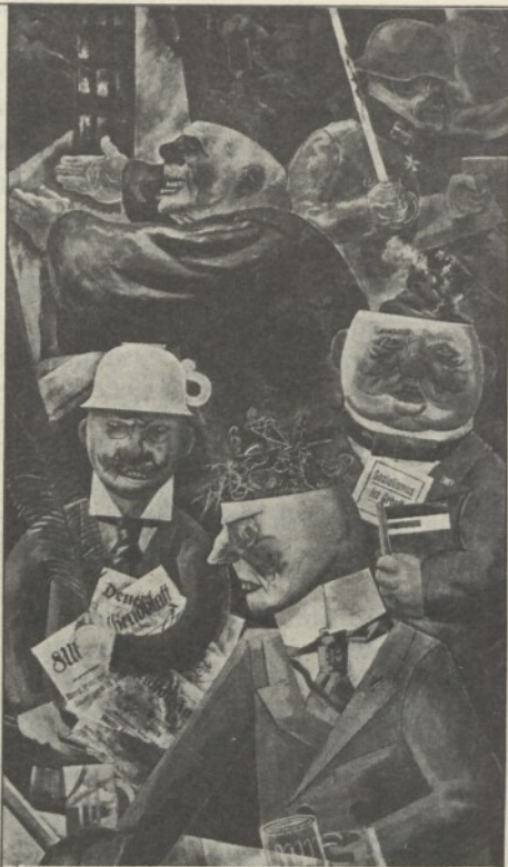
George Grosz Le colonne della società

Sinteticamente: a mio avviso, la colpa delle inammissibili deficienze