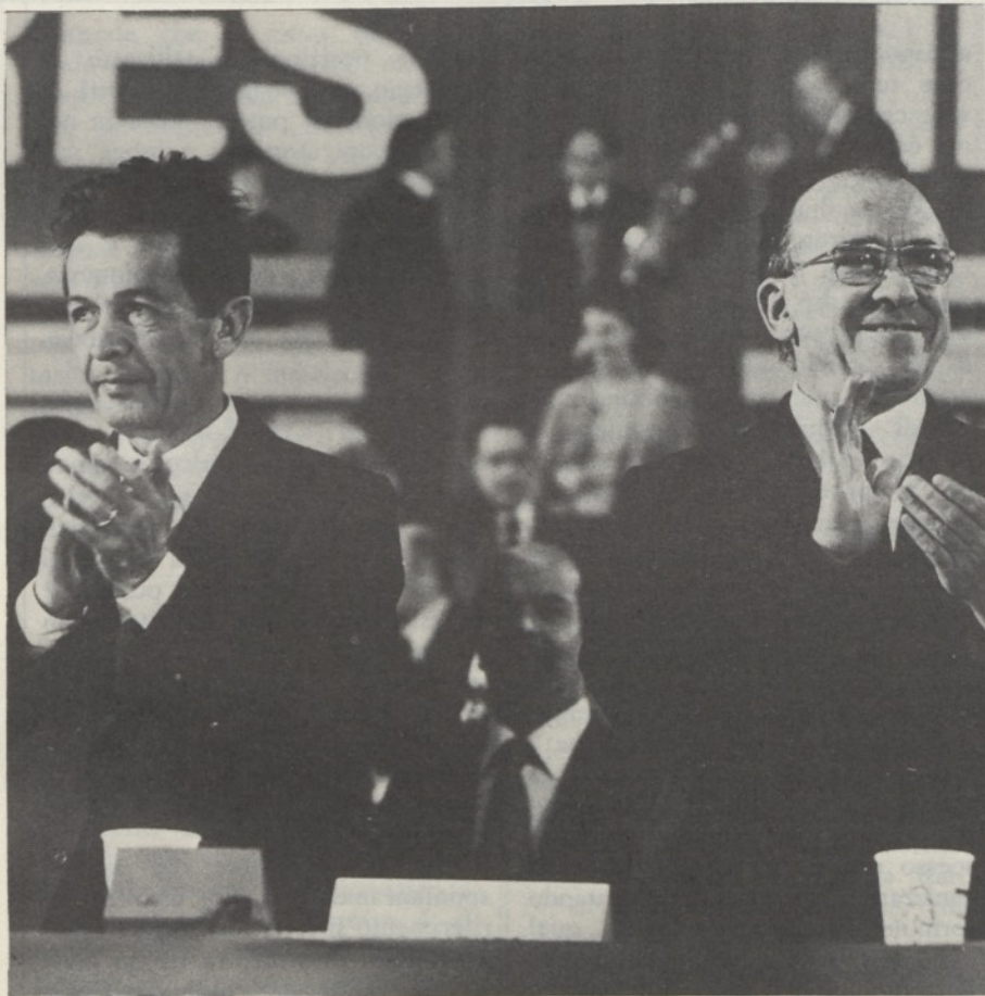
Berlinguer e Carrillo

Al di là dei dissensi teorici, tuttavia, c'è qualcosa di concreto che il gruppo dirigente sovietico paventa: ed è il « contagio » della linea eurocomunista, cioè la sua influenza concreta sull'evoluzione del dibattito nei paesi socialisti ed anche nell'URSS. È mio parere che, accanto ai successi nei paesi in cui operano, sia questo il metro di giudizio di fondo per valutare la validità e l'efficacia della strategia dei singoli partiti comunisti occidentali. Sotto questo punto di vista, si rivelano superficiali i giudizi di quegli osservatori che contrappongono il « coraggio » di Santiago Carrillo alla « prudenza » di Berlinguer. È di moda adesso sostenere che i comunisti spagnoli hanno assunto la leadership dell'eurocomunismo, mentre