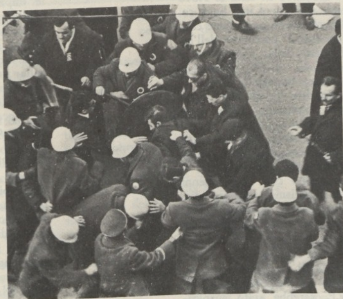
Scontri tra manifestanti di sinistra e polizia a Istanbul

La Turchia si trova ad andare avanti con tutte le incombenze ed i bisogni di un paese moderno ma con le caratteristiche prevalenti di altri paesi del Terzo Mondo. Non si può dire però che esistano similitudini nelle forze che si muovono a Teheran e ad Ankara. Ma esiste una logica comune che è quella delle forze profonde che si muovono con forti accenti di fanatismo religioso dietro il quale, al momento degli sbocchi possono sempre avanzare interessi indesiderati.