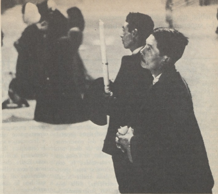
Nella Cattedrale di Bogotà