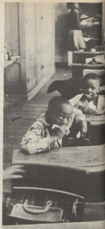
New York, Harlem: una scuola della Lenox Avenue