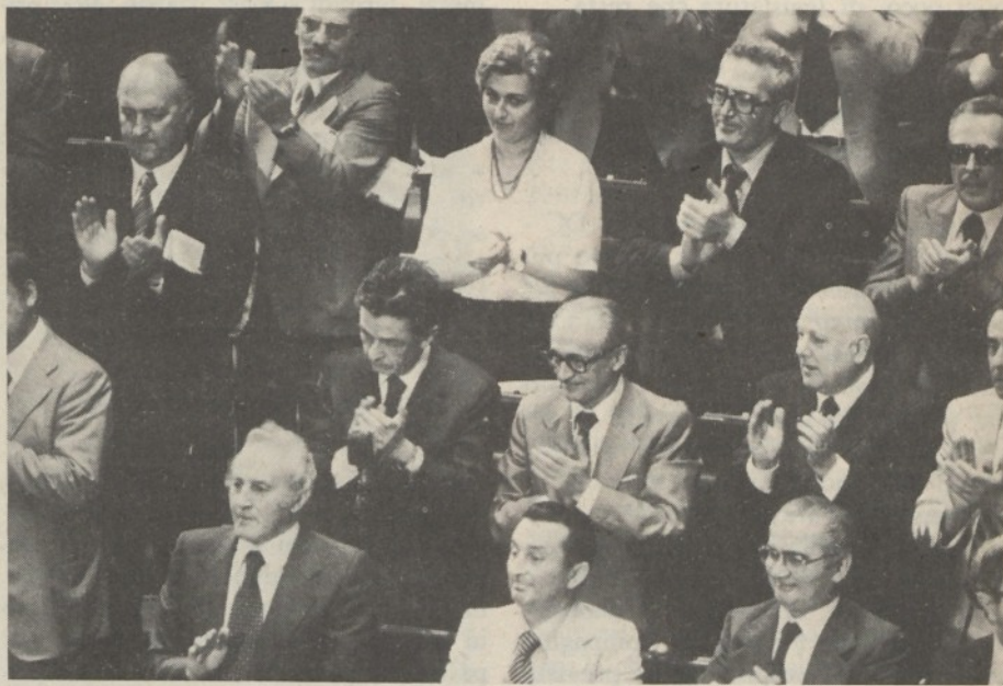
Al centro, Berlinguer e Natta

Tutto ciò appare persino ovvio. E' dunque da chiedersi se quella del PSDI sia stata solo fretta o addirittura imperizia. Noi diremmo proprio di no. Se le cose fossero lasciate andare per il loro verso, se cioè si attendesse di accertare la vera sostanza del piano triennale e se questa fosse quale è da temere, sarebbe difficile per tutti non arrendersi all'evidenza e non concludere che è giunto il momento di mettere la DC con le spalle al muro per quanto riguarda il quadro politico, e cioè per quanto riguarda l'ingresso del PCI nel governo. Ma chi è che veramente vuole questo ingresso? La DC sappiamo di no. Il PRI lo vorrebbe ma ci rinuncia, e con sincero disappunto, perché ritiene insuperabile il rifiuto della DC. E gli altri due partiti? Qualcuno dice di volerlo, ma sia lecito dubitare. Un governo a quattro senza il PCI ma con lo stesso programma votato dal PCI, sarebbe comodo sia che i comunisti dessero l'appoggio esterno sia che tornassero all'opposizione: nell'un caso e nell'altro, si offrirebbero nuove esche per una certa polemica anti-PCI avviata a sinistra. Ecco perché la minaccia di crisi formulata da Pietro Longo non è sembrata tutta farina del suo sacco.