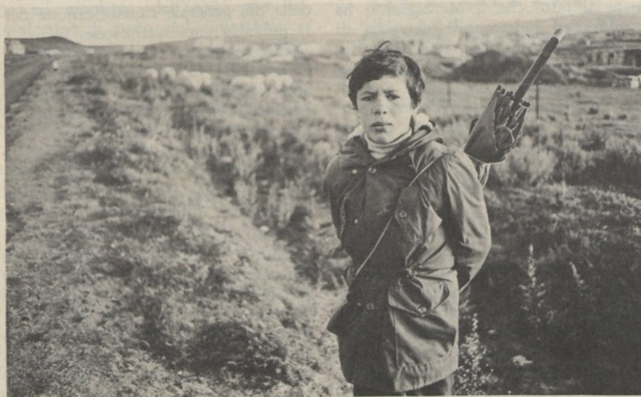
Un garzone pastore di Ottana (Nuoro).

dei rapporti sociali ed in cui l'impresa rivendica il controllo assoluto di tutte le leve del potere, a livello programmatico, decisionale e di spesa, al di fuori di qualsiasi controllo istituzionale e sindacale.