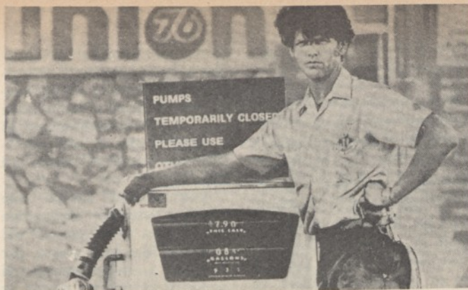
Pompista-pistolero in una stazione di servizio USA

serio intervento amministrativo inteso a contenere la domanda.