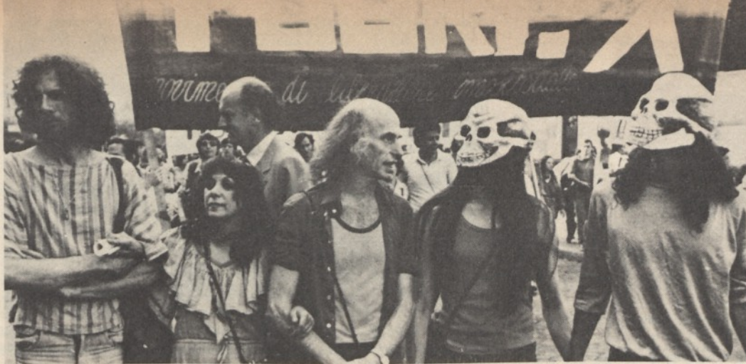
Manifestazione per l'energia pulita a Roma: al centro Beck e la Malina del «Living Theatre»

to e Israele contro la quale paesi come la Libia, l'Iraq o il Kuwait mobilitano ogni sorta di rappresaglia, compresa quella petrolifera.