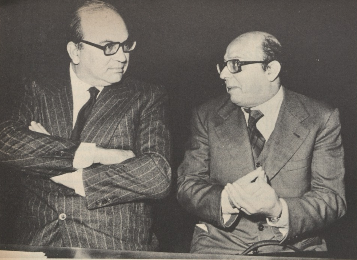
Craxi e Galloni

assodato, in Italia scoppiano quando servono a qualche manovra politica tesa a indebolire qualcuno. Allora, nel 1958, era lo « scandalo Giuffrè » che vide il socialdemocratico ministro delle Finanze on. Preti contro i democristiani Medici e Andreotti rispettivamente ministri del Bilancio e del Tesoro. Ma la posta di quello scontro non era l' anonima banchieri del Giuffrè, ma i futuri equilibri politici. Il governo. E anche oggi abbiamo il nostro bravo scandalo bancario, quello che implica addirittura la Banca Centrale. In coincidenza di una svolta politica. Casualità.