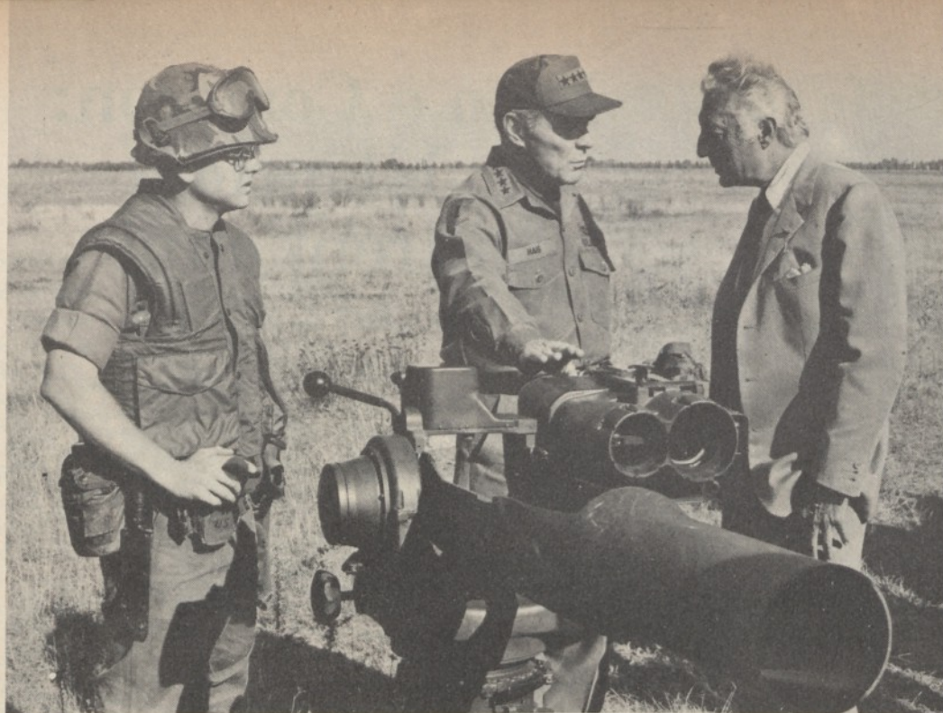
Il generale Haig e l'avvocato Agnelli

Il rapporto con l'Occidente ha però esposto i paesi del Comecon alle varie crisi.