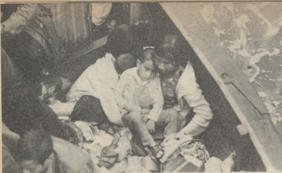
Profughi vietnamiti nel mare della Cina