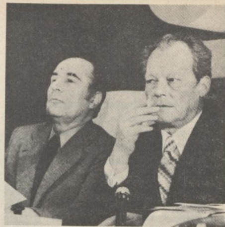
Mitterrand e Willy Brandt

unitaria in nome dei lavoratori che da tutta l'Europa ci hanno mandato là.