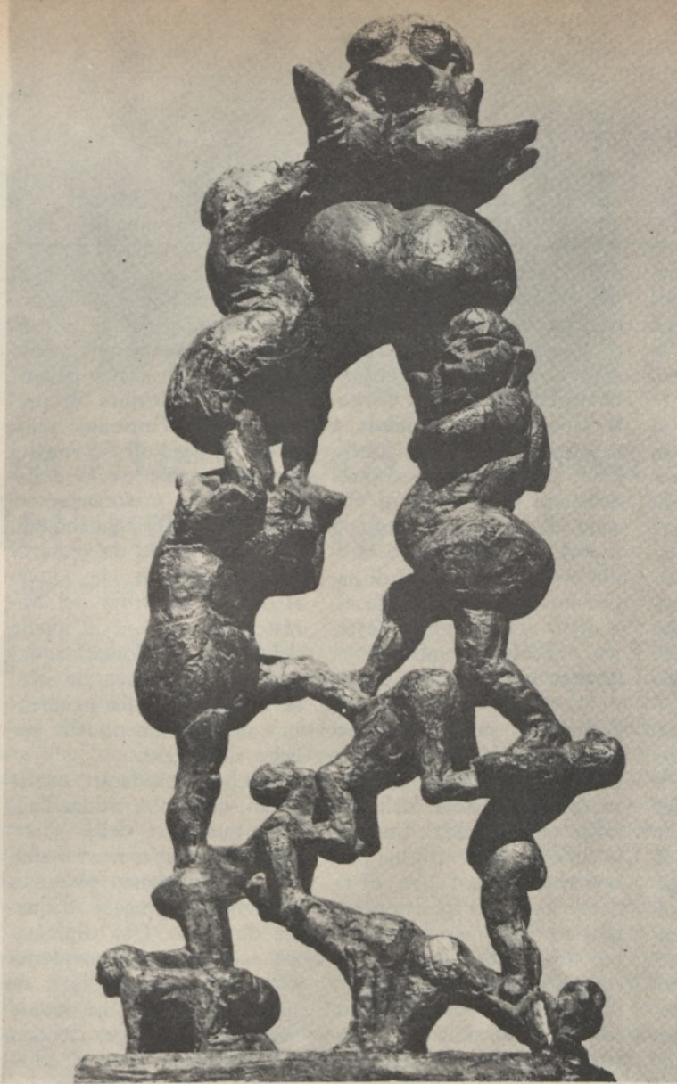
Mazzacurati: Marino bozzetto per un monumento alle gerarchie

per far decadere ogni corretto intento riformatore a vantaggio di funesta demagogia.