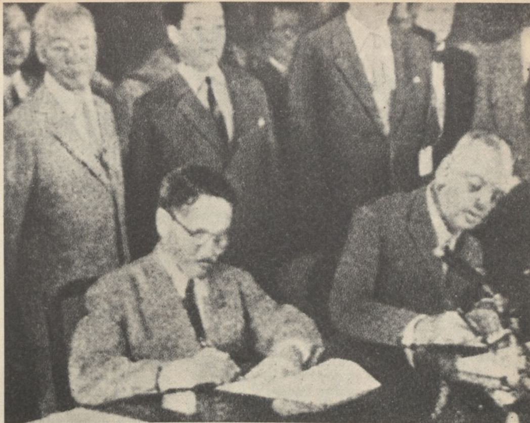
La foto della storica firma dell'armistizio nella guerra del 1953