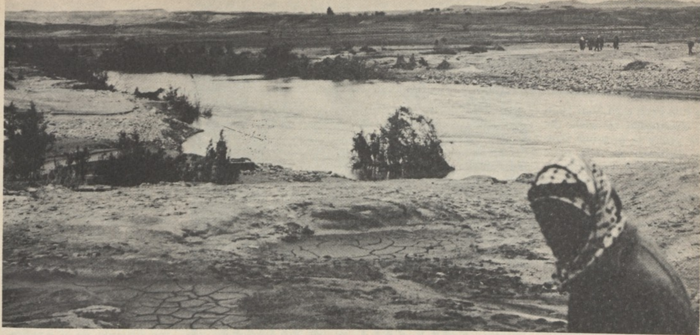
Il Giordano attuale confine tra Israele e Giordania