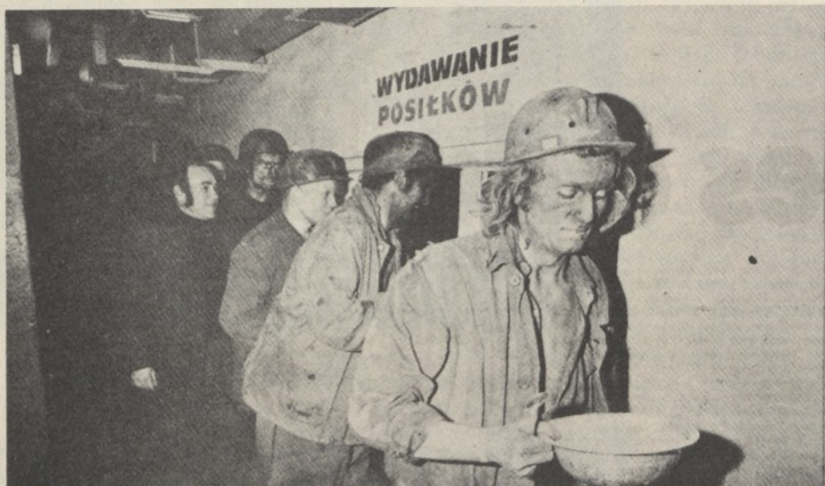
Minatori polacchi al rancio

● Nella Polonia di oggi una giornalista televisiva, Agnieszka, ricostruisce per il suo diploma di regia la figura di un operaio degli anni '50. Il lavoro non è facile: freni burocratici, difficoltà nel reperimento del materiale, reticenza dei diretti interessati. Ma Agnieszka ha una sua nervosa irruenza che le permette, scocciando a dritta e a manca, di superare parte degli ostacoli.