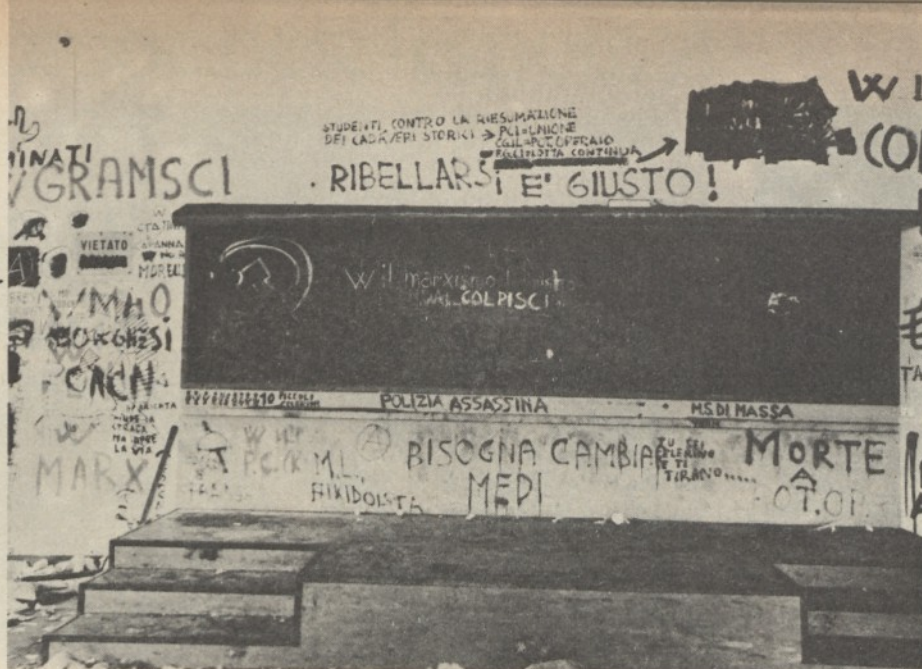
Roma 1968: un'aula di Lettere e Filosofia