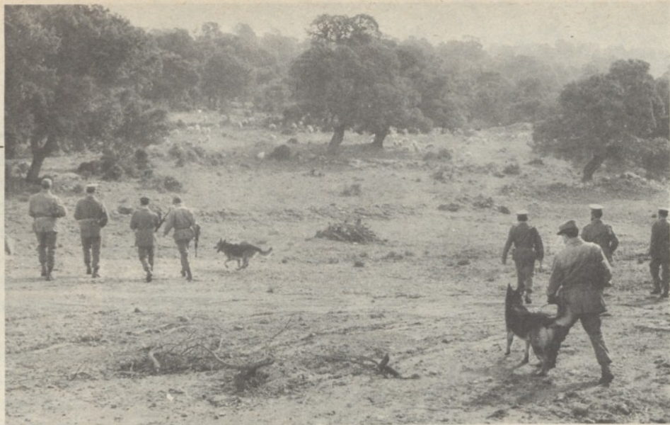
Rastrellamento in Barbagia (Nuoro)

Terrorismo e criminalità comune in Sardegna