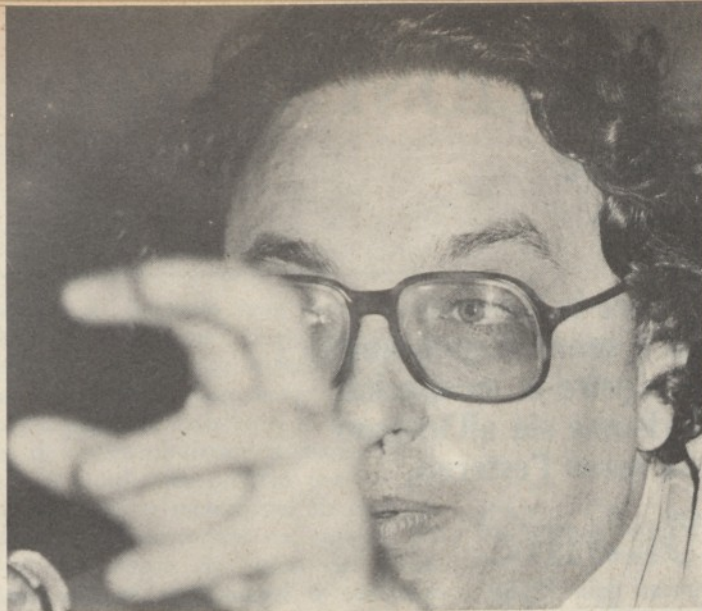
Il ministro delle PP.SS.