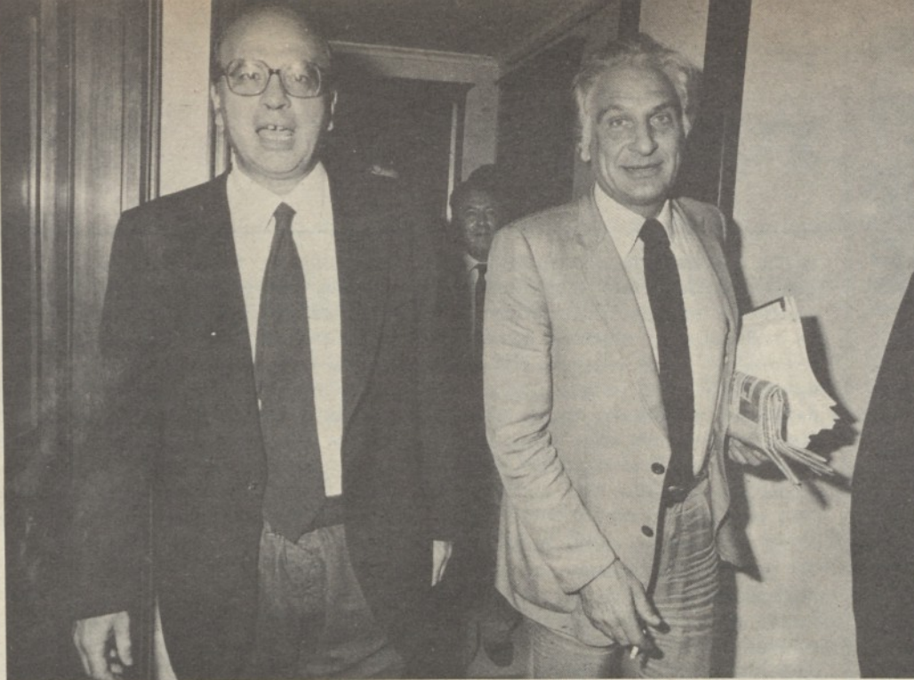
Craxi e Pannella

Un radicale parla del Partito e del suo 24° Congresso