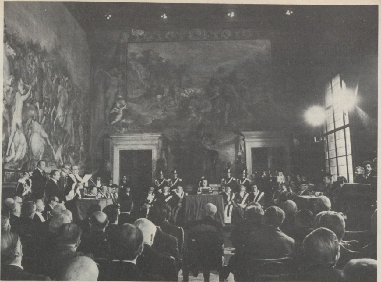
Al centro di spalle: Il presidente Pertini