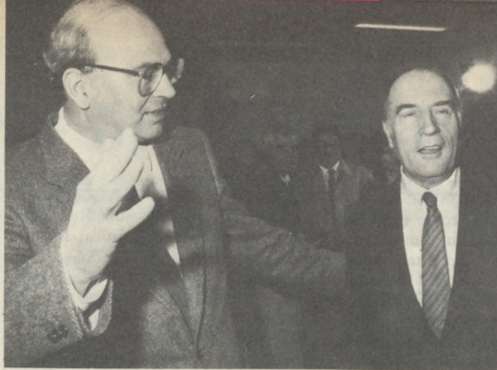
Craxi e Mitterrand