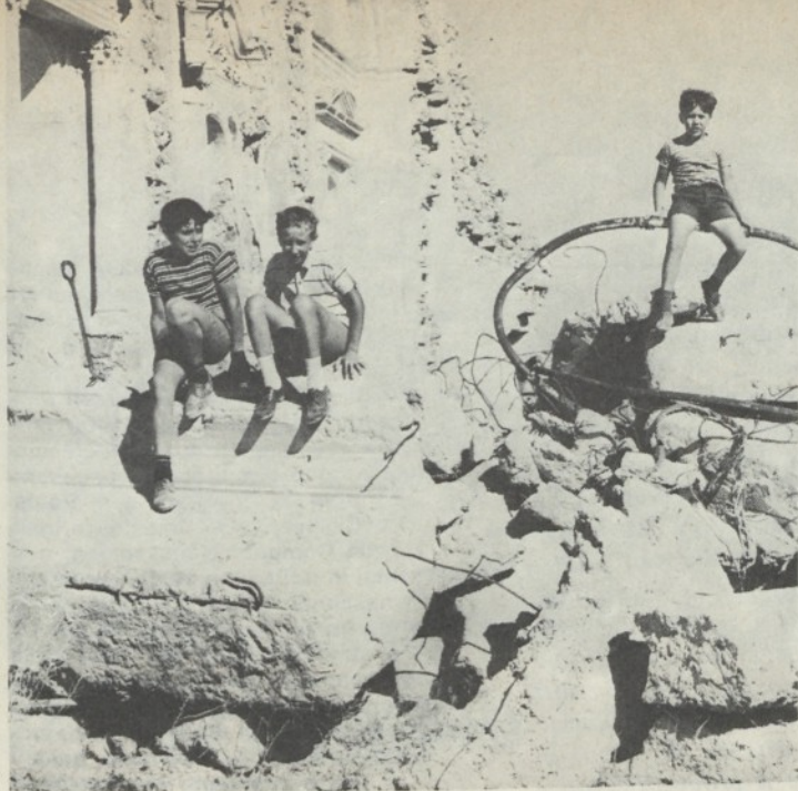
Tra le rovine della Chiesa Madre di Santa Ninfa