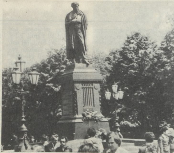
Mosca: il monumento a Puskin