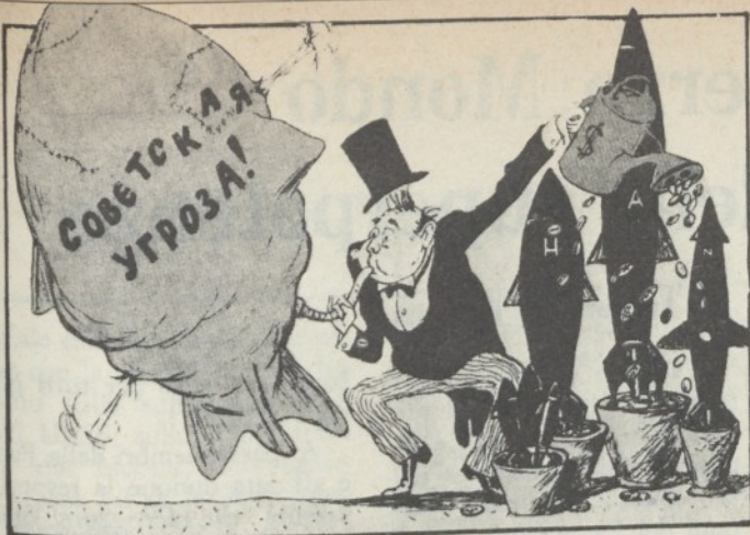
Il « pericolo sovietico » gonfiato dai mercanti di cannoni Usa