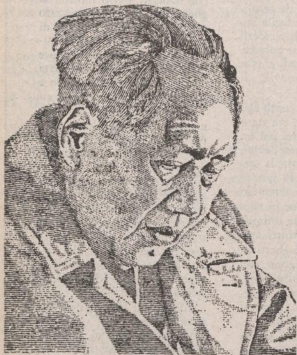
(da The Economist )

DI UNA cosa almeno siamo sicuri, Mao non ci ha illusi, né sorpresi, né ingannati. Sfogliamo il volume dei suoi "Scritti scelti di argomento militare" (Pechino, edizione in lingue estere, 1963). La politica entra di pieno diritto in questa raccolta di articoli, messaggi, discussioni di strategia e di guerriglia, perché nessuno, più di Mao, è persuaso che la guerra è una cosa troppo seria per lasciarla fare ai generali. "I compagni del puro punto di vista militare considerano gli affari militari e quelli politici come opposti, e ricusano di riconoscere che l'azione militare è solo uno dei mezzi per compiere certi compiti politici; pensano che il compito di un'armata rossa, come di un'armata bianca, sia solo