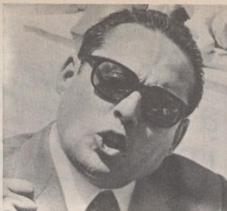
Luciano Liggio il capo mafioso latitante

ruggenti 1962-1966, sul cui capo pendono alcuni procedimenti penali, inquisito dall'Antimafia, forte del potere politico che lo sorregge, ha dato querela al dott. Vicari, capo della polizia italiana; Vicari, a sua volta, ha querelato Ciancimino. Le querele hanno suscitato clamore nazionale e tuttavia sono rientrate nel silenzio, silenzio che puzza di omertà lontano un miglio;