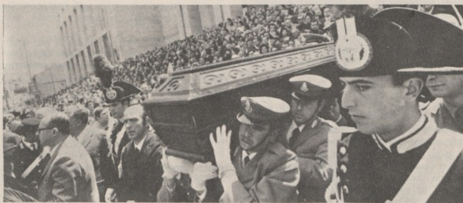
Palermo: i funerali del Procuratore Scaglione

Su questo terreno, attorno a questi individui privi di coscienza morale, in