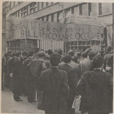
... e della Renault

Il rilievo immediato che al suo interno siano presenti alcune delle maggiori concentrazioni imprenditoriali fra quelle riscontrabili nell'economia occidentale, non è certo sufficiente a giustificare quella sorta di leadership che, di fatto, viene riconosciuta all'industria automobilistica. E nemmeno forse il fatto che si tratti di una tipica industria motrice, in grado di esercitare ampiamente una funzione traente, ma per ciò stesso insieme egemonizzante, su un processo di diffusione dello sviluppo, per cui gli stadi congiunturali che essa attraversa si ripercuotano a catena su strati sempre più ampi di imprese « periferiche ».