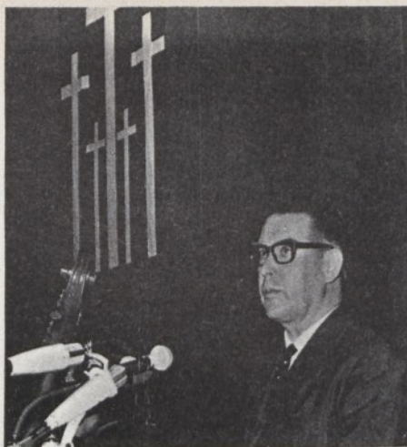
Il ministro della difesa Gerhard Schröder

fiducia che potrà essere concessa dai sindacati a Brandt è quindi a termine; e i risultati di questa fiducia non potranno farsi aspettare troppo a lungo.