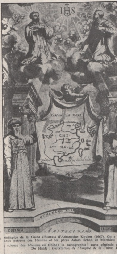
Una immagine dal libro « I gesuiti in Cina »

Il piano di padre Wei si propone di sbloccare una situazione di rottura diplomatica — consumatasi nel 1951 con la espulsione dalla Cina del Nunzio a Pechino, mons. Riberi — e una situazione di scisma religioso, determinatasi tra il 1956 e il 1958. E' soprattutto la lacerazione religiosa, difficilmente dissociabile dal suo contesto