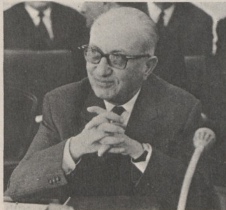
Il generale Spantidakis

Ma è doveroso rilevare come questa sorta di rapida riconquista di un più ampio posto nel cosiddetto concerto delle nazioni abbia profondamente deluso, ed anche scoraggiato gli esuli ed i resistenti greci i quali hanno sempre posto al primo punto delle richieste che essi rivolgono ai sostenitori europei l'isolamento politico e diplomatico del governo di Atene. Può darsi che rileggendo le