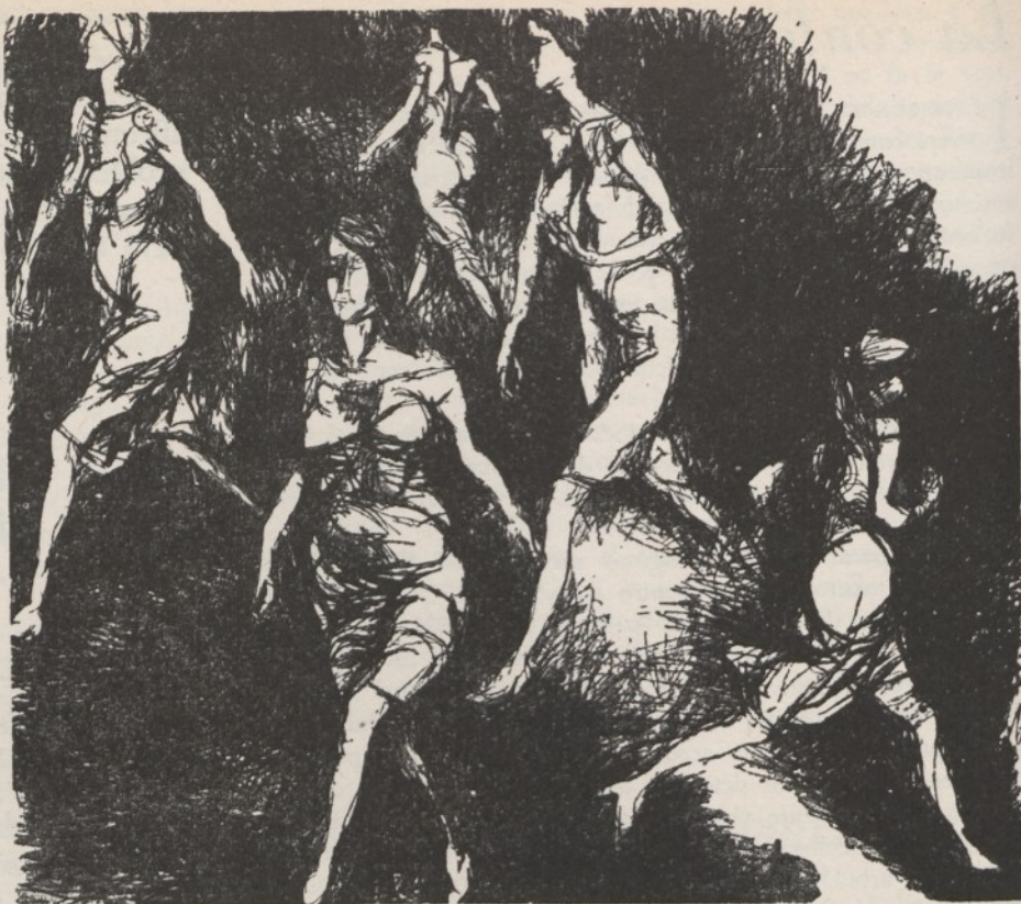
Renato Guttuso: «Figure che camminano» (1959)

Ecco perchè, da molti anni e con puntuale tenacia appaiono sui giornali (ora dovremo dire apparivano) accorate lettere di commesse che chiedono una mezza