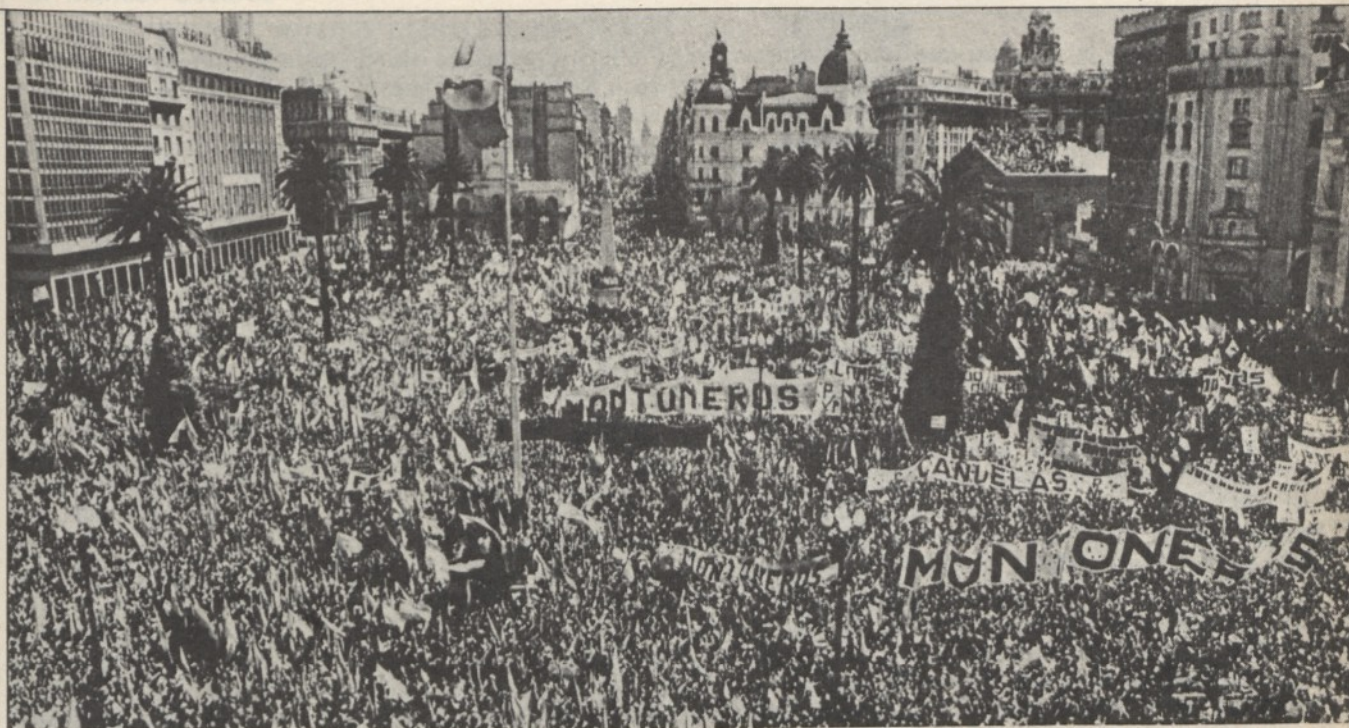
Argentina, 1975: manifestazione di Montoneros.