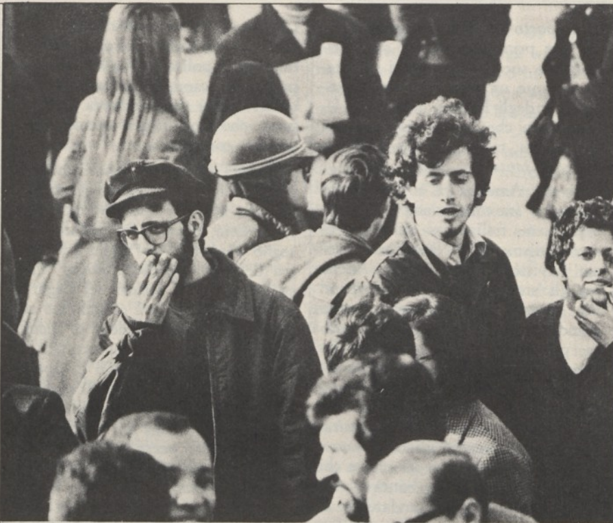
Una manifestazione di studenti.

I brigatisti e i componenti di tutti gli altri commandos rivoluzionari operanti sul nostro territorio non sono parenti scemi o bambini del Pdup, di Avanguardia Operaia, di Lotta Continua o del Movimento lavoratori per il socialismo, ma veri e propri « nemici di classe ». Altrimenti la differenza finisce per essere solo teorica: roba da analisi e da slogans. Nappisti e brigatisti potreb-