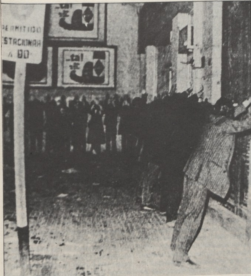
Buenos Aires, aprile 1976: una retata dei militari.

● In conseguenza delle sue sconfitte nel Sudest asiatico e in Africa e anche della svolta a sinistra in Italia, Francia, Spagna e delle entrate in scena del proletariato europeo, l'imperialismo nordamericano si arrocca in America Latina. Il cambiamento del rapporto di forza a suo sfavore lo costringe — con una mossa difensiva — a cercar di preservare il suo ventre morbido, la fonte più prossima delle materie prime.