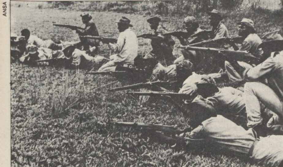
Guerriglieri in azione.

● « Vitoria ou morte » (organo di informazione del MPLA stampato a Brazzaville), nel settembre 1967, così definiva i contenuti della rivoluzione angolana: « l'indipendenza nazionale deve sostituire la vecchia società sfruttatrice con una nuova società libera dai mali della precedente e completamente in grado di realizzare le aspirazioni delle masse sfruttate ».