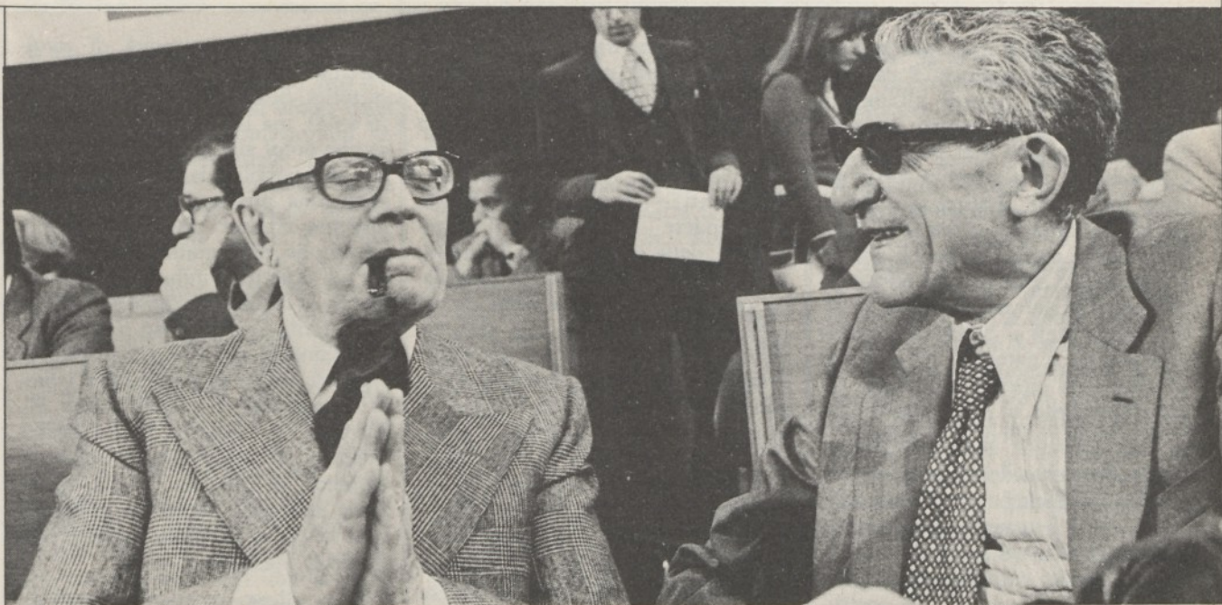
Pertini e Lombardi.

Il congresso faceva propria la formula della alternativa, un motivo che la sinistra lombardiana aveva portato avanti con coerenza negli ultimi anni, ma che adesso nella generale accettazione da parte di tutte le correnti diveniva una espressione non certamente univoca. Ed è proprio tale equivocità, a nostro avviso, spiega il mancato rafforzamento nelle elezioni politiche. Infatti il partito in tutti i suoi quadri ha spiegato un notevole attivismo ma è mancata la risposta dell'elettorato che tende a guardare con maggiore favore le posizioni nette rispetto alla situazione concreta in cui si opera.