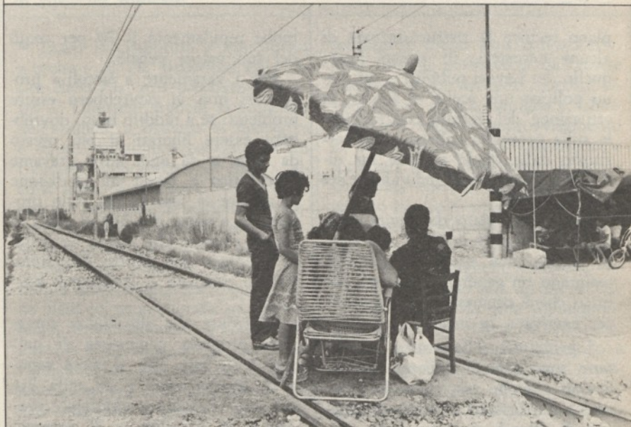
Marina di Melilli: blocco sulla ferrovia CT-SR per protesta contro l'inquinamento

● Il discorso di Andreotti, la sera del primo ottobre in televisione, ha dato la sensazione di un nuovo corso ma da quel discorso, purtroppo, non sono uscite le parole magiche: pianificazione territoriale ed urbanistica, servizi sociali . L'urbanistica è una scienza sociale che ha, in Italia, un significato cosmico in quanto simboleggia tutte le cose che un paese — con un territorio dalla rara preziosità ma anche dalla rara esiguità e precarietà geologica — avrebbe dovuto fare per la pianificazione agricola, industriale ed urbana, per le infrastrutture e per rendere più umana e intelligente la esistenza quotidiana. Ha invece imitato il più grave errore del vecchio capitalismo costruendo megapoli e desertificando centri dalle civiltà più certe e durature, in un processo di concentrazione caotica e alienante.