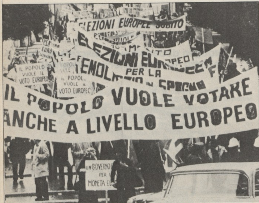
Roma: Manifestazione di federalisti per l'elezione a suffragio diretto del parlamento europeo

● Si sono dileguati i fiacchi osanna e subito spenti gli effimeri fuochi che qua e là erano stati accesi per salutare la decisione adottata dal Consiglio della CEE, il 20 settembre scorso, di avviare il processo che dovrebbe sfociare nella elezione del Parlamento Europeo a suffragio universale e diretto. La spiegazione sta prima di tutto nella incertezza intrinseca alla decisione, nei suoi limiti.