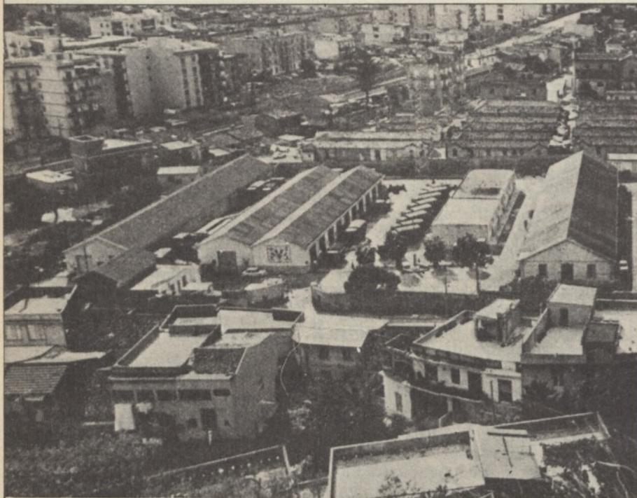
Messina: speculazione edilizia ai margini di un quartiere-ghetto

● Berlinguer che tiene tranquillo il suo comizio in una Reggio ancora memore dei « boia chi molla » è anch'esso un indice del maggior consenso oggi riscosso dall'idea democratica nel Mezzogiorno. Indicazioni di identico valore non mancano al di là dello Stretto, vedi la vicenda messinese ultimamente all'attenzione delle cronache nazionali. Uno scandalo per abusi edilizi: a prima vista non dissimile dai tanti ovunque ricorrenti, in realtà emblematico, per il particolare evolversi dei fatti, dell'affacciarsi nella realtà politica locale del « nuovo corso » di cui sopra.