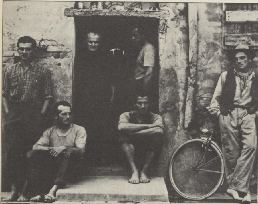
Paul Strand: Famiglia, Luzzara 1953

● Che effetto fa, a chi legga oggi a ritroso il percorso fotografico di Paul Strand, il suo senso del realismo? Quello che esiste anche nel cinema italiano degli stessi anni e che sembra trovare nelle immagini del fotografo americano un confronto e una conferma?